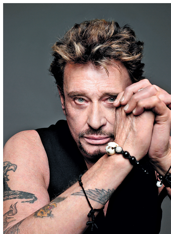
FESTIVAL D'ÉTÉ DE QUÉBEC

On est en février, au studio Mel's de Saint-Hubert, dimanche soir de gala à Star Académie. Début de l'opération reconquête du Québec. Johnny Hallyday va chanter tantôt, deux gros medleys de ses chansons les plus connues chez nous — Ma gueule , Quelque chose de Tennessee , Les portes du pénitencier , Que je t'aime — avec les staracadémiciens, pour deux millions de téléspectateurs. Tout le monde est fébrile, j'ai croisé René Angélil en chemin vers la loge et j'ai eu peur qu'il m'embrasse sur la bouche comme dans les films de mafia et que mon compte soit bon. Mais non,