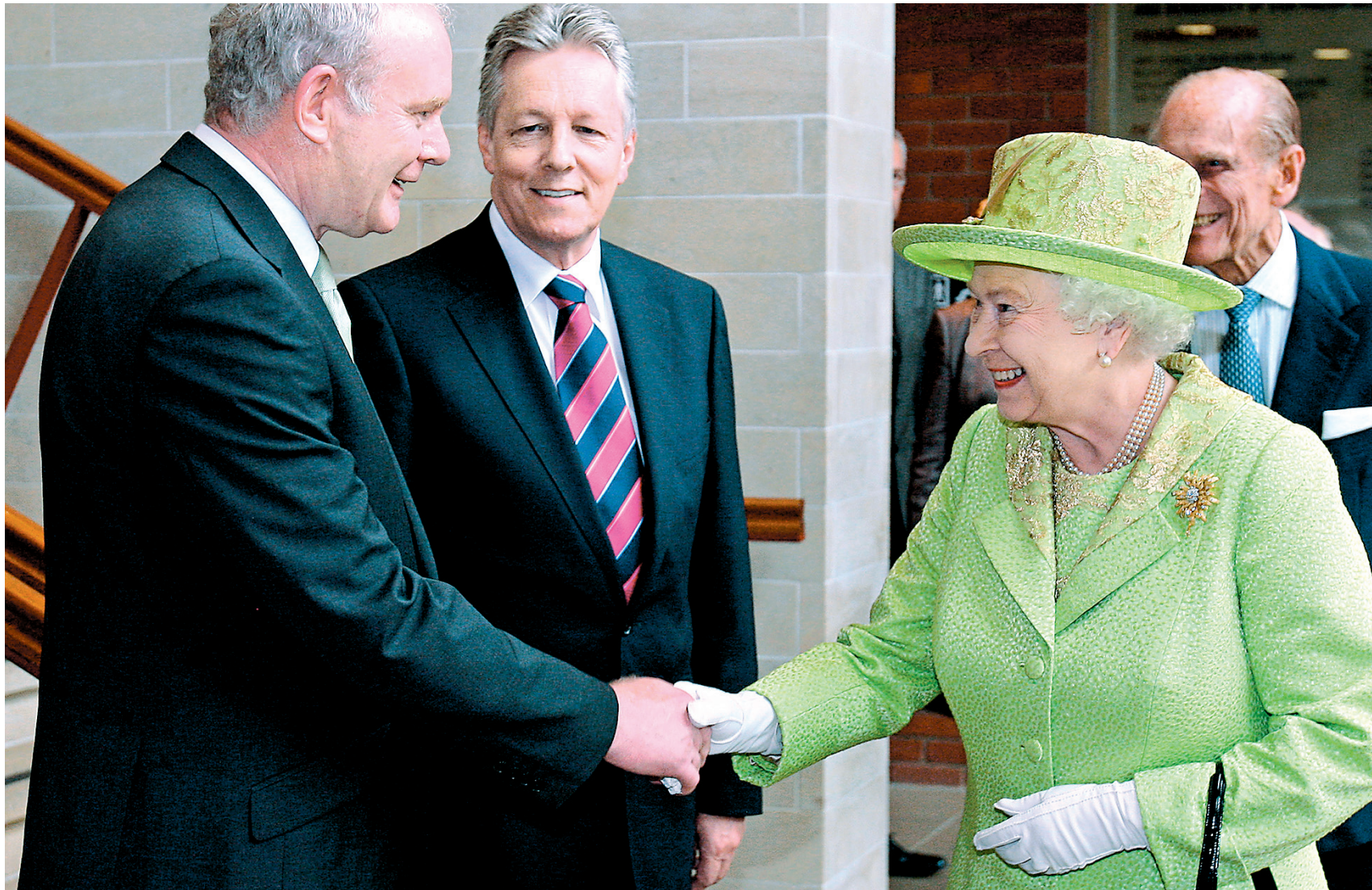
Selon les « faiseurs d'opinion », la poignée de main entre Martin McGuinness, ancien haut commandant de l'IRA, et la reine Elizabeth II, le 27 juin dernier, constitue une nouvelle ère.

Voyons pourquoi cette poignée de main ne fait pas l'unanimité en Irlande du Nord, et pas seulement chez les quelques partisans de la lutte armée. Elle n'est, en réalité, que l'aboutissement logique et inévitable des Accords du Vendredi saint de 1998. En 1969, le gouvernement britannique s'est vu contraint d'envoyer l'armée en Irlande du Nord afin de mettre fin aux affrontements entre catholiques et protestants provoqués par le refus du gouvernement nord-irlandais de réformer l'État.