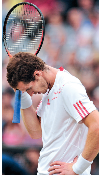
Andy Murray a échoué à procurer à la Grande-Bretagne sa première victoire à Wimbledon depuis 1936.