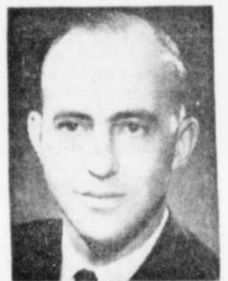
Honorable CLEMENT VINCENT Ministre de l'Agriculture et de la Colonisation.