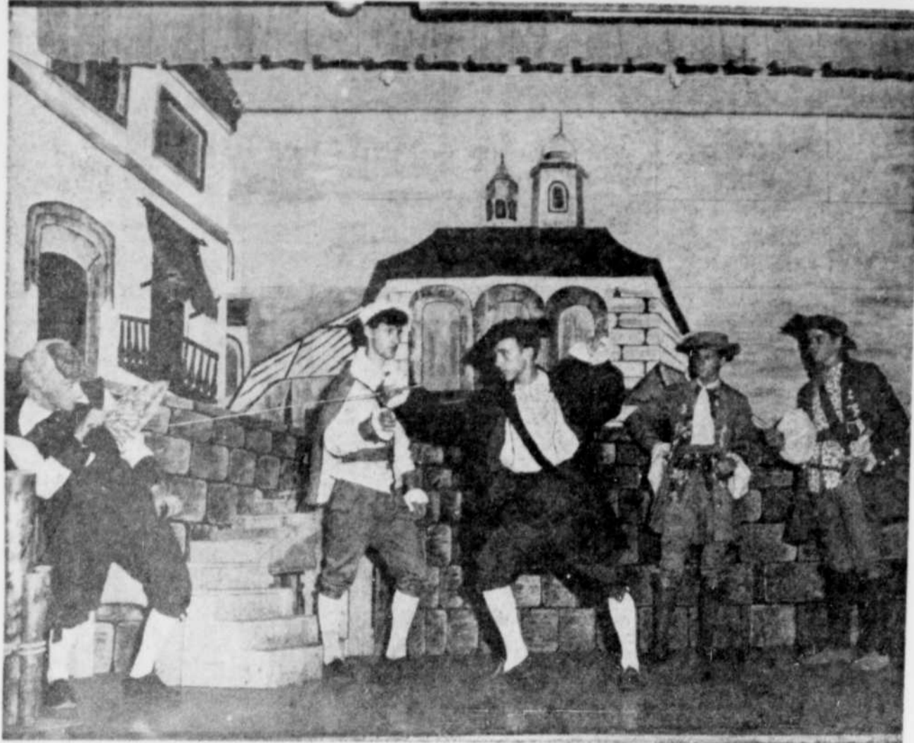
LES JEUNES COMEDIENS amateurs qui font partie de la troupe des Vagabonds de La Tuque pratiquent quotidiennement en vue de la grande première de leur pièce "Les Fourberies de Scapin", qui aura lieu le 7 août prochain. Ils effectueront une tournée au