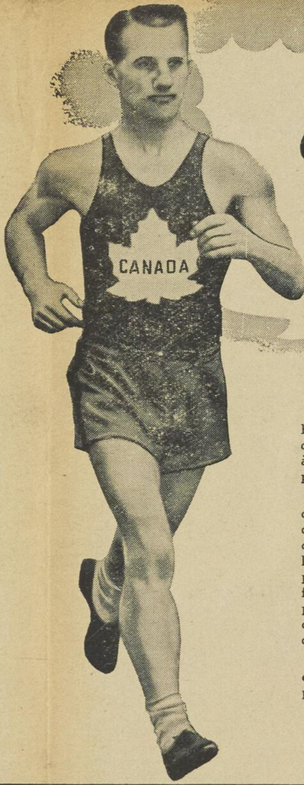
PAT BOULTON fameux coureur de marathon

Ils sont priés de se rapporter à la Place de l'Eglise, à 10.30 heures a.m. Les vétérans de la guerre 1914-18 sont priés de porter leurs décorations et ceux de la guerre actuelle pourront porter leur uniforme.