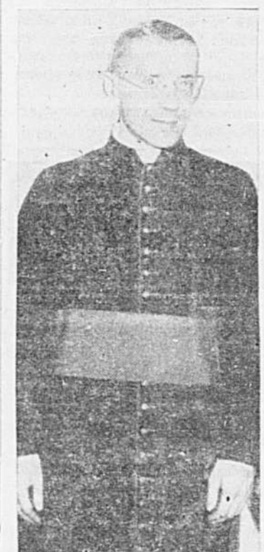
S. Exc. Mgr Frenette

La population catholique du nouveau diocèse est de 75,000 âmes. Le diocèse compte 115 prêtres dont 35 sont attachés à l'enseignement au séminaire de St-Thérèse.