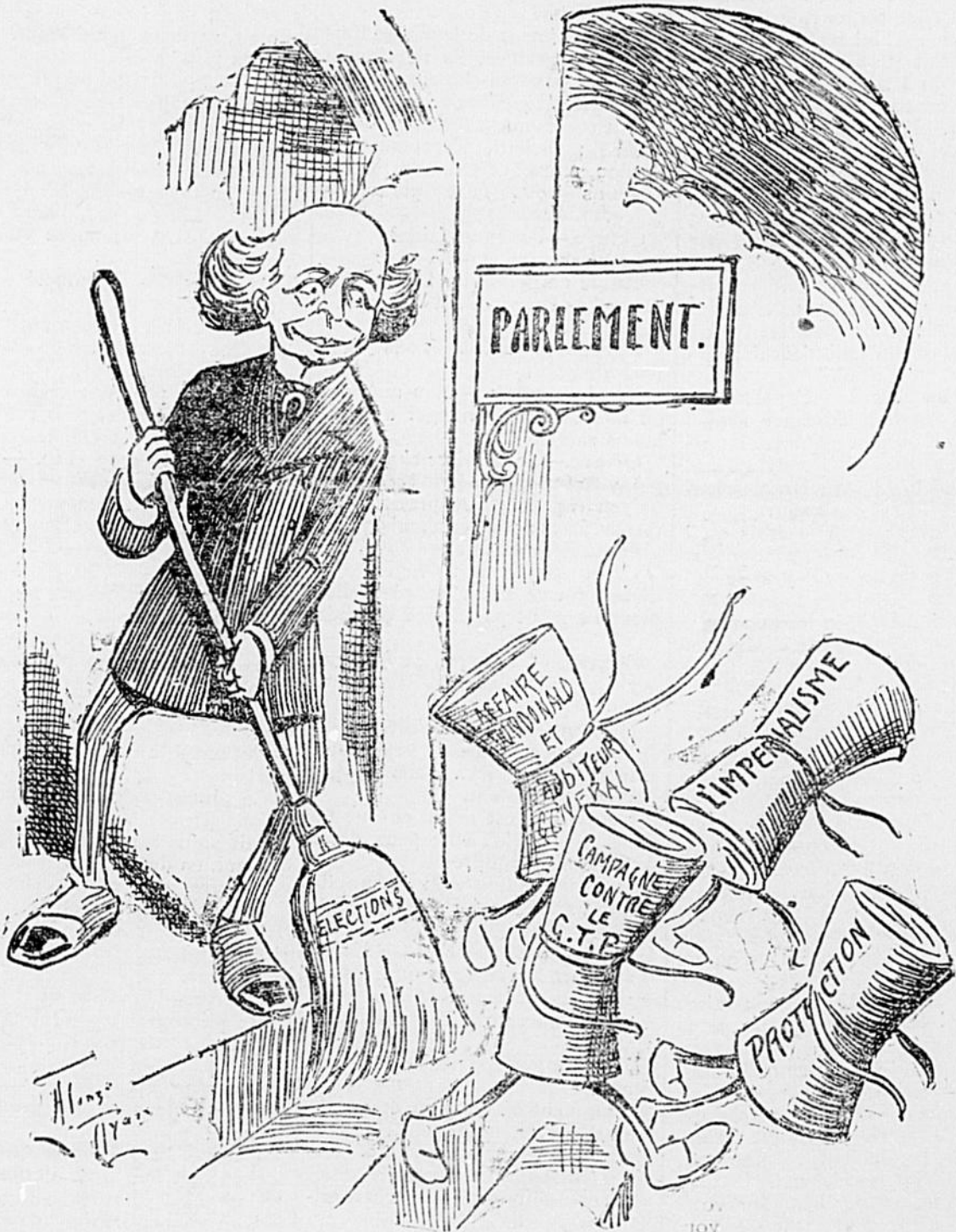
SIR WILFRID. — Dehors !... tas de badreux.

Deux braves paysans regardent passer un ballon.