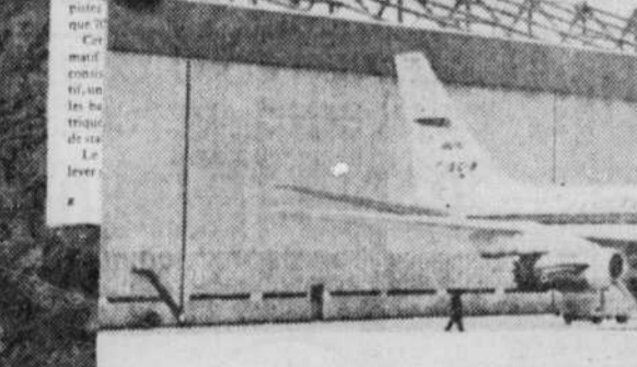
La base d'entraînement de l'Air Canada à Montréal.

La mise en service, le 15 septembre, des quatre avions DC-8 d'Air Canada a été précédée de la construction d'une nouvelle base d'entraînement et de réparation qui est la première au monde à avoir été conçue et financée par avions à réaction.