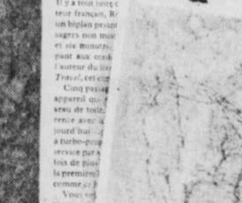
Un Vanguard en service d'Air Canada.