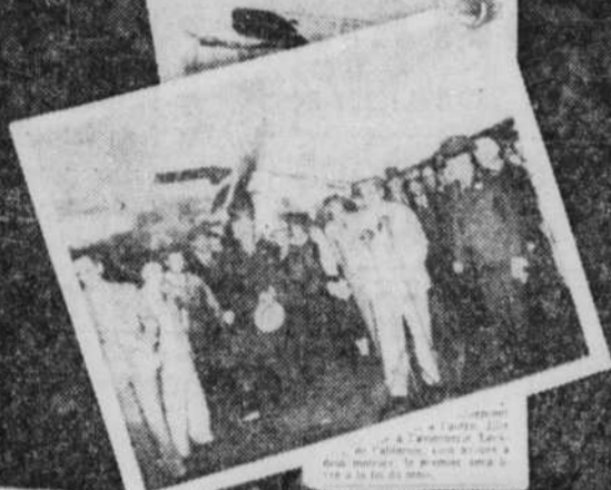
Le premier vol de la ligne gouvernementale Vancouver-Seattle, le 15 septembre 1942.

Air Canada a récemment assumé la gestion de la ligne aérienne gouvernementale qui relie Vancouver à Seattle.