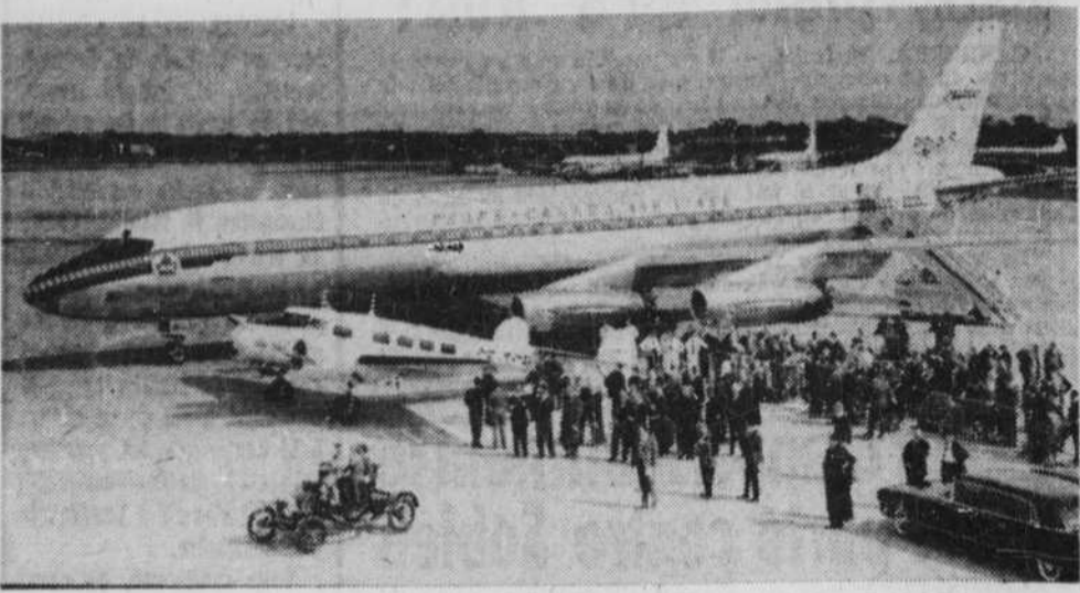
En vingt-cinq ans, le progrès d'Air-Canada se manifeste dans cette photo du premier appareil, le Lockheed 10-A, à côté du plus récent, le DC-8.

Le 1er septembre 1937, Air-Canada inaugura son premier service de transport de passagers entre Vancouver (Trinité) et Seattle (Washington).