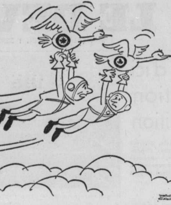
C'est fou ce qu'ils peuvent faire à Ottawa pour économiser...