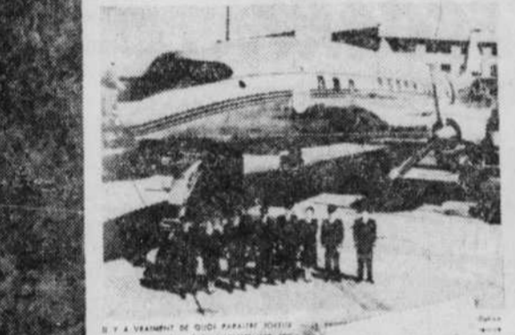
Un avion de ligne d'Air Canada en service transatlantique.