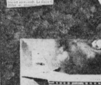
Le service sera assuré quotidiennement.