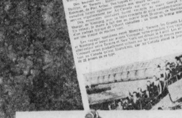
Un Viscount en service d'Air Canada.

C'EST UN ATTRACTIONNELLE ajout dans les années de l'aviation qui voit naître le Viscount, un avion de ligne impressionnant.