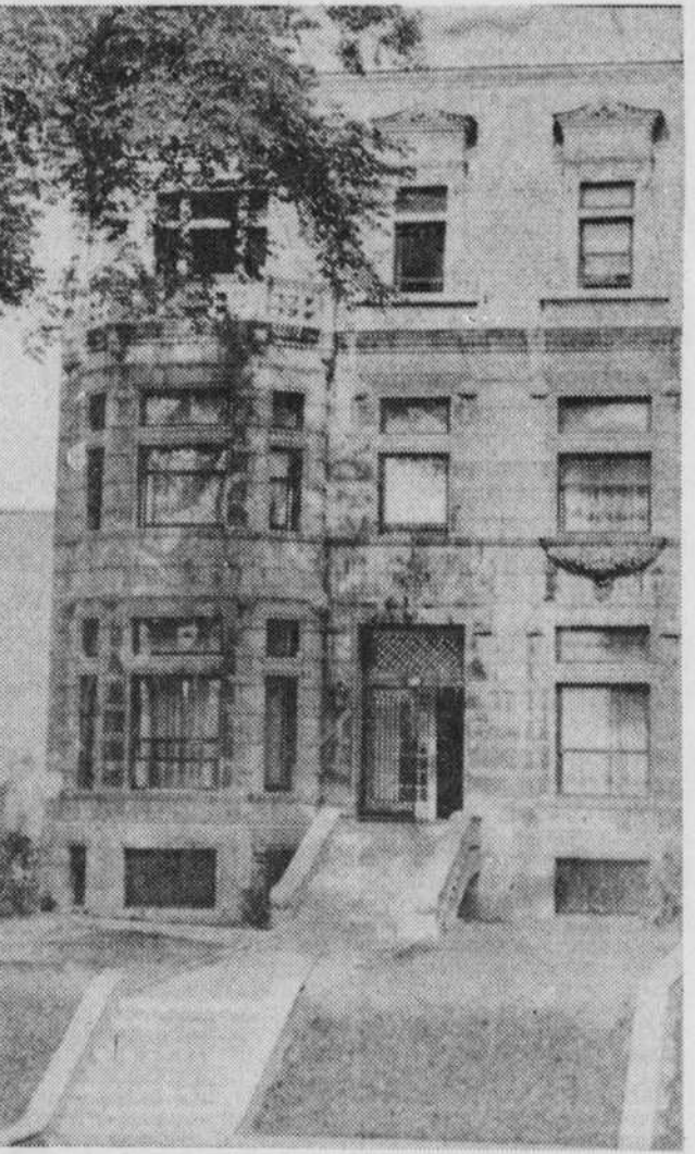
Le Cercle universitaire de Montréal, qui est présentement logé dans une des plus vieilles maisons de la rue Sherbrooke, projette de se reloger sur le même emplacement, après avoir démolé l'immeuble actuel que l'on voit ci-haut. De tels projets ne sont pas définitifs, mais on croit qu'une décision sera prise à ce sujet avant la fin de semaine prochaine.