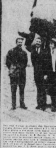
Le service de messagerie Air Canada d'un océan à l'autre.

Le service sera désormais assuré quotidiennement d'Ici à Vancouver.