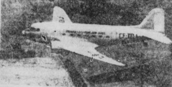
Un Douglas DC-3 en service d'Air Canada.

Le premier d'entre eux a été livré à l'Air Canada à Montréal, le 15 septembre 1942.