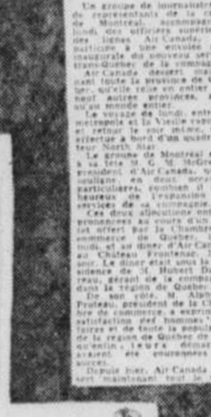
Un North Star en service d'Air Canada.

Le service Trans-Québec assure par des North Star et des DC-3