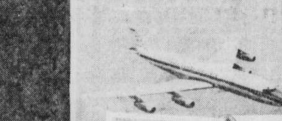
Un DC-8 en service d'Air Canada.