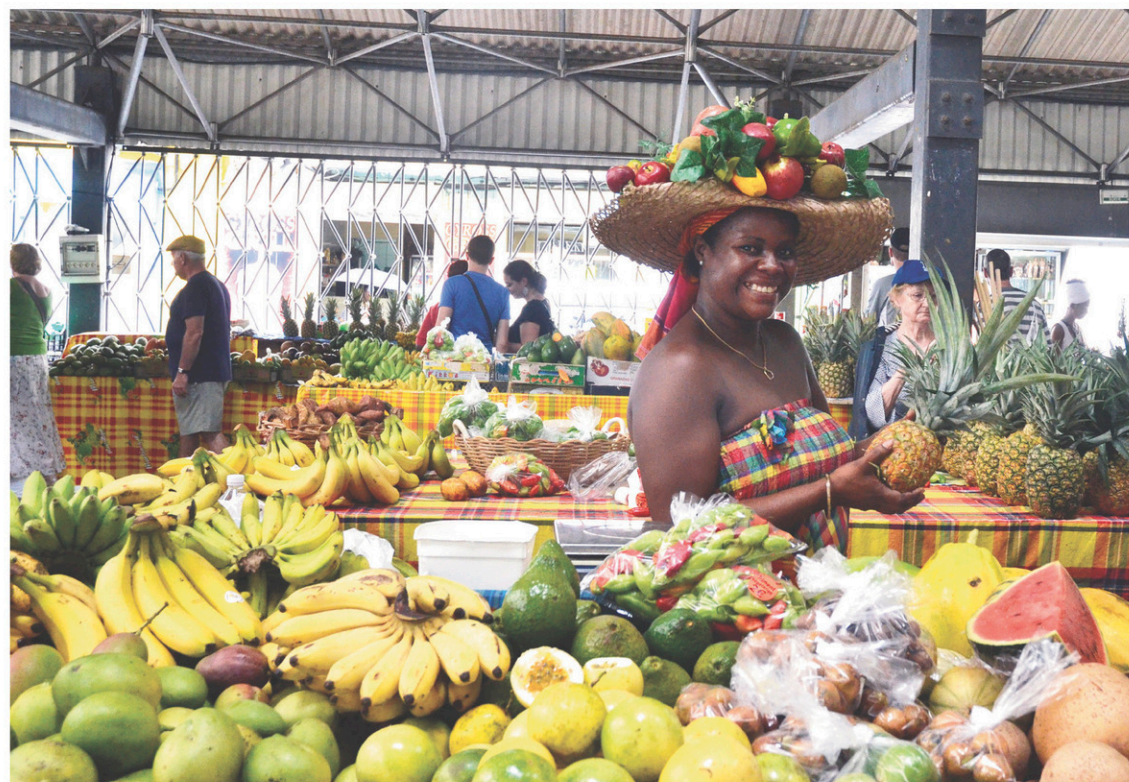
Le grand marché de Fort-de-France, en Martinique

En entrant dans la baie de Fort-de-France, notre regard se pose sur le fort Saint-Louis. Bâtie à la Vauban au XVII e siècle, cette citadelle militaire est l'une des mieux conservées des Antilles. Vue de la mer, l'île de 70 kilomètres, dans sa partie la plus longue, et de quelque 30 kilomè-