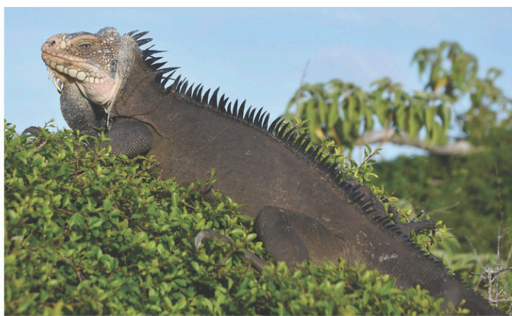
L'iguane antillais de la réserve de Petite-Terre, à La Désirade

Combien d'esclaves en fuite sont venus se réfugier sur les pans de ces pics verdoyants et dans les grottes et les tunnels du canyon de l'anse L'Ivrogne, lors de la rébellion de 1748. Et