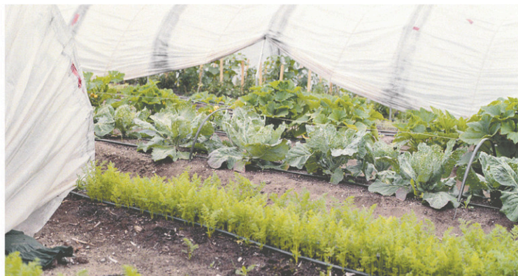
La Coop de solidarité forestière de Minganie-Le Grenier boréal propose depuis 2013 des fruits et des légumes aux 490 habitants de Longue-Pointe-de-Mingan.

Aussi, les marchés publics d'automne et de Noël se développent beaucoup à travers le Québec, même si l'offre alimentaire y est parfois sous-représentée. Il y a donc un glissement de saisons à opérer si l'on veut cultiver et manger lo-