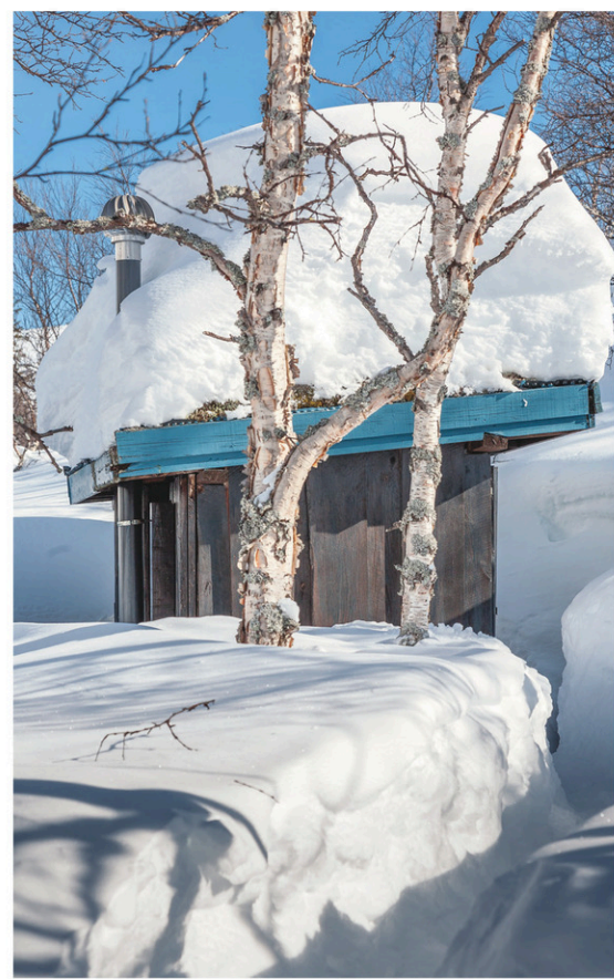
Un cabinet extérieur enneigé à Hjørtedal, en Norvège