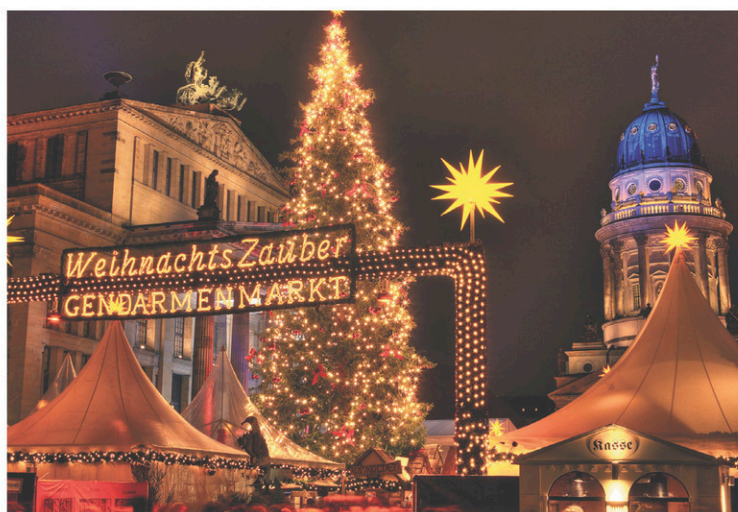
Le marché de Noël du Gendarmenmarkt