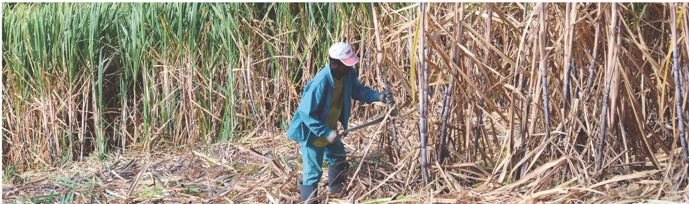
Un coupeur de canne à Saint-Pierre, en Martinique

Une semaine sur chaque île donne le temps de visiter, mais aussi de grimper des volcans à grand spectacle. Certains éteints ou assoupis, d'autres dégagant toujours des fumerolles de soufre attestant que l'activité volcanique est encore d'actualité dans cette région des Petites Antilles.