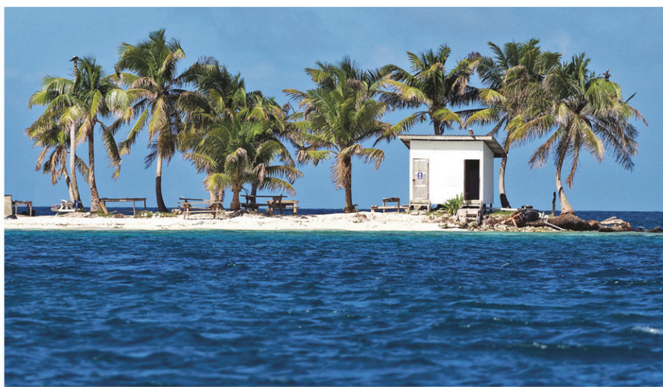
L'île aux toilettes près de Placencia, au Belize. Ci-contre: les latrines du café Archteck à Berlin, en Allemagne.