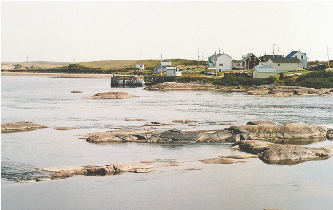
Aguanish, petit village situé entre Natashquan et Baie-Johan-Beetz. La station-service fait office de dépanneur et de petite épicerie.

« Pour moi, la nordicité dans l'assiette, ce serait de manger plus en accord avec les saisons. Comme le faisaient nos grands-