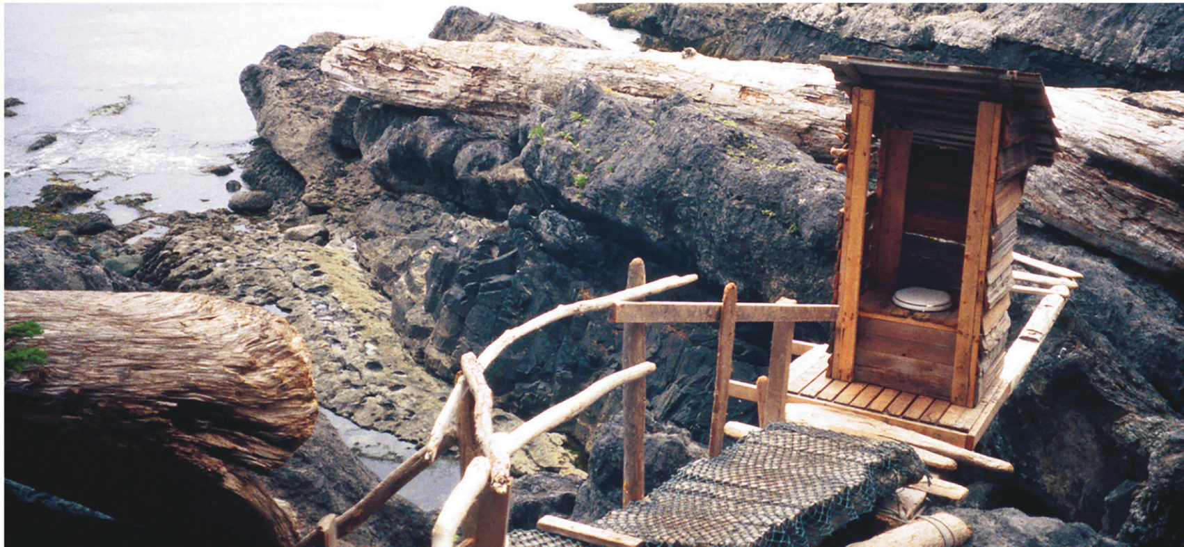
Une toilette stratégiquement située en Colombie-Britannique

Au mieux, ces lieux ne sont en général qu'un passage obligé sans autre forme d'attrait ou d'esthétisme minimal. Parlant d'esthétisme, ce ne sont certes pas ces cabanes improvisées, qui