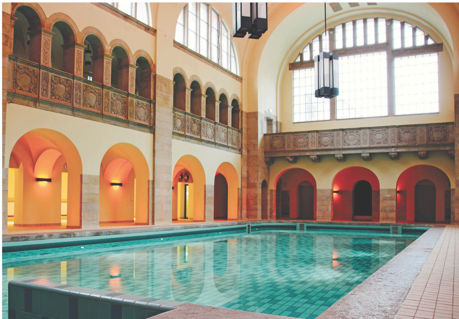
La piscine publique du nouvel hôtel Oderberger

Pour profiter au mieux de l'esprit des Fêtes à la berlinoise, on ira siroter un verre de vin chaud dans l'un des nombreux marchés de Noël de la ville, comme celui qui est installé à côté de l'église du Souvenir (Kaiser Wilhelm, sur la Kurfürstendamm; schaustellerverband-berlin.de ). Celui du Gendarmenmarkt ( gendarmenmarktberlin.de ) organisera notamment une fête le 31 décembre prochain. À la porte de