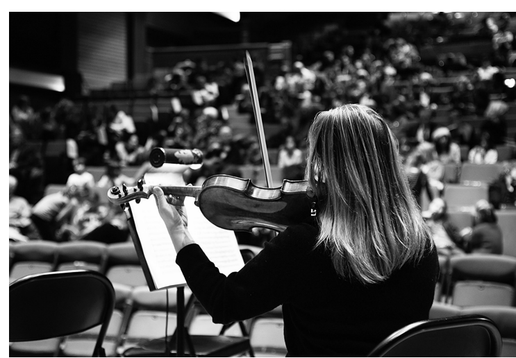
L'œuvre de Sergueï Prokofiev est idéale pour faire découvrir la musique classique aux enfants.

Tout l'automne, pour le compte de l'orchestre de musique de chambre Appassionata, le duo a fait la tournée des écoles les plus défavorisées de la Commission scolaire de Montréal: 41 ateliers donnés dans 18 écoles à plus de 1500 enfants, le tout culminant dans un grand concert sur ce conte musical joué peu