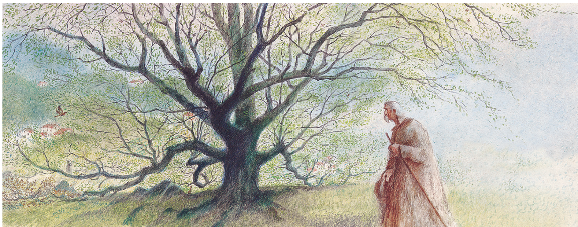
SOCIÉTÉ RADIO-CANADA, AVEC LA PERMISSION DE LA FAMILLE BACK

Un dessin tiré de L'homme qui plantait des arbres , chef-d'œuvre qui valut de nombreux prix à Frédéric Back, dont l'Oscar du meilleur film d'animation en 1987.