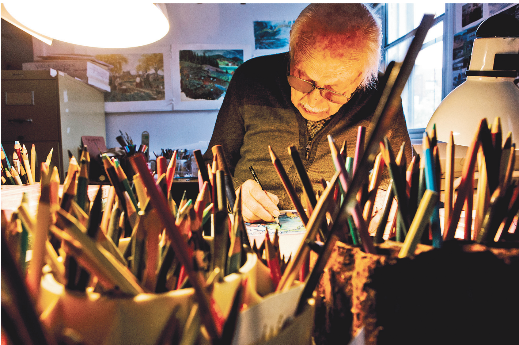
RENAUD PHILIPPE LE DEVOIR

FRÉDÉRIC BACK, L'HOMME QUI AIMAIT LES ARBRES