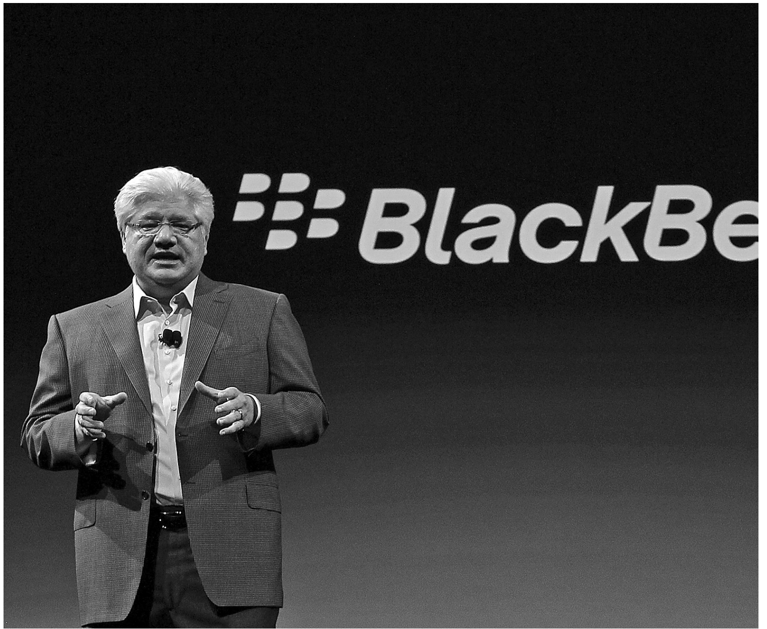
Mike Lazaridis, cofondateur de Research in Motion (RIM)

Selon le président John Chen, qui croit que BlackBerry sera encore en vie en 2016 — et rentable — l'accord avec Foxconn signifie que l'entreprise ontarienne pourra «faire ce qu'on fait le mieux: la design, la sécurité, le logiciel et la gestion de mobilité dans les entreprises».