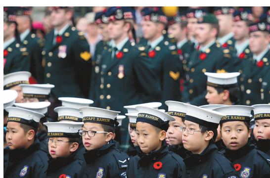
Certains des 53 000 cadets canadiens devront réutiliser et échanger des uniformes usagés.

Les cadets se font plutôt dire d'acheter eux-mêmes leurs manteaux, ainsi que leurs propres vêtements de sport. «Malheureusement, vous devrez porter votre propre manteau par-dessus votre uniforme si la météo l'impose», indique un ordre daté du