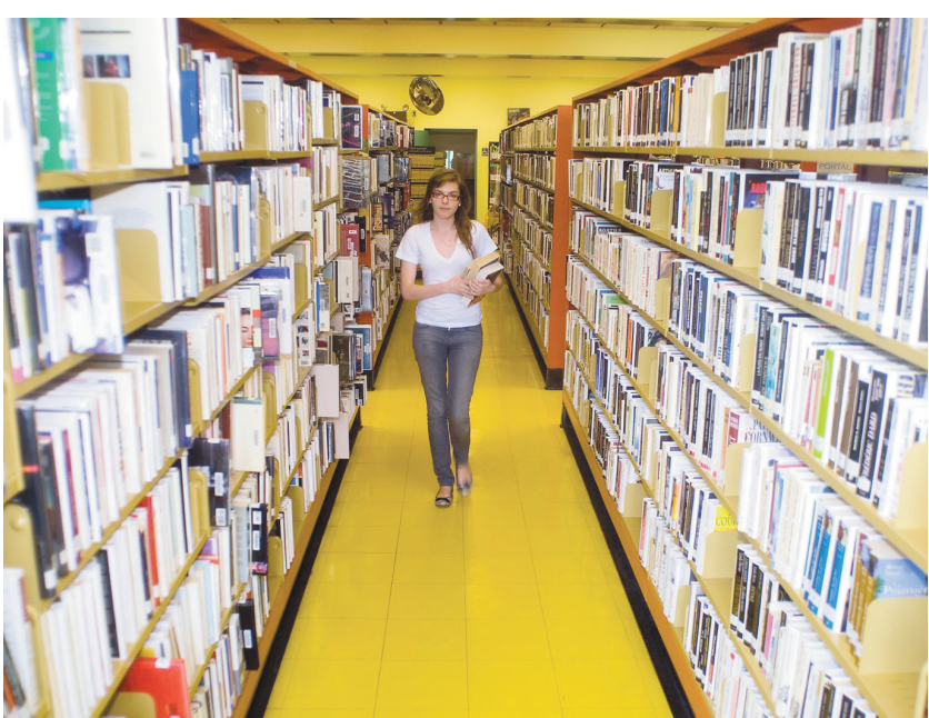
PEDRO RUIZ LE DEVOIR

Avis légaux..... B 6 Décès..... A 6 Météo..... B 7 Mots croisés..... B 8 Petites annonces..... A 6 Sudoku..... B 7