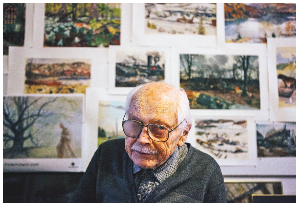
RENAUD PHILIPPE LE DEVOIR

Dès son arrivée à Montréal, Frédéric Back succède à Paul-Émile Borduas à l'École du meuble. En 1952, il est embauché au tout nouveau réseau de télévision Radio-Canada à titre de lettré et d'illustrateur. Au studio d'animation de la société d'État, en 1969, il réalise son premier film d'animation, Abra-cadabra , sur les péripéties d'enfants du monde entier unis