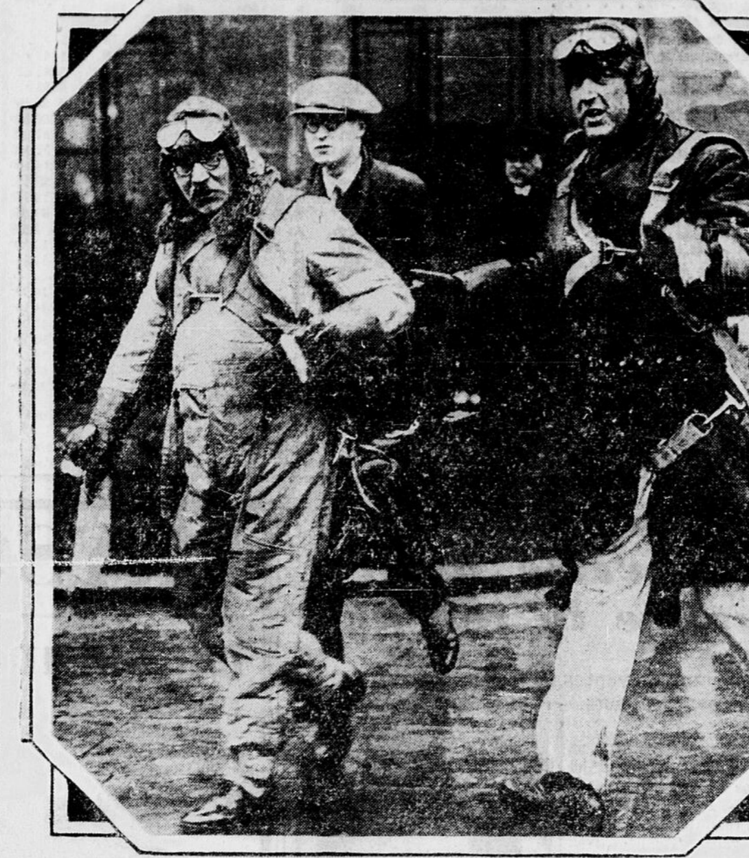
On voit ici le Premier Ministre Ramsay MacDonald en costume d'aviateur, gagnant son aéroplane à Croydon, Angleterre, lors de son envolée récente à Paris, en route pour Genève, où il a assisté à la conférence de désarmement.