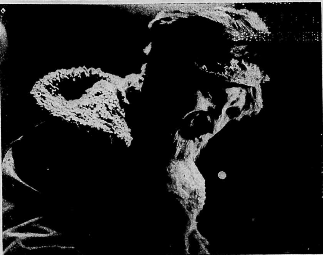
Le vieux défricheur