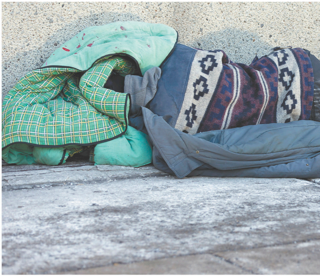
Des centaines de sans-abri souffrant d'une dépendance à l'alcool continuent de dormir dans les rues de la métropole, faute de ressources pouvant accueillir les personnes intoxiquées, selon la Ville.

« Il y a des clientèles qui ne vont pas dans les refuges, note