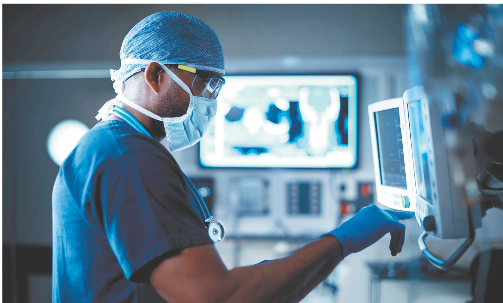
Le rapport des médecins spécialistes à l'argent devrait être remis en question, selon l'auteur.

Les femmes constituent la moitié du monde. Elles doivent constituer la moitié des parlements.