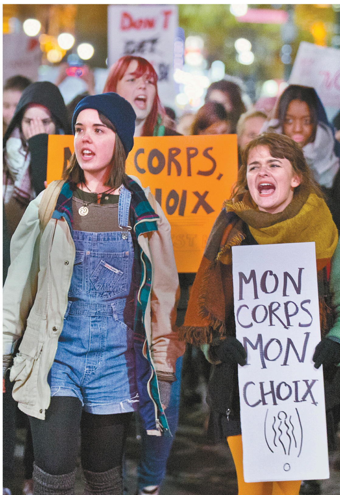
Année après année, les femmes prennent la rue le 8 mars, Journée internationale des femmes, l'occasion de faire le point sur la lutte pour l'égalité. Cette année, cette journée a une saveur toute particulière avec le mouvement de dénonciation publique des agressions sexuelles.