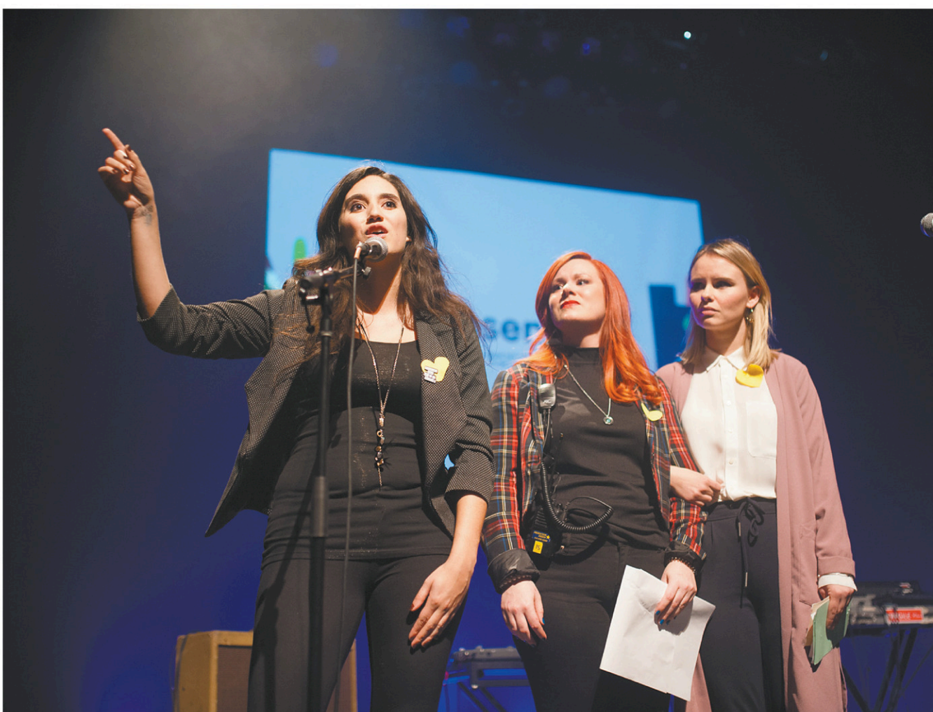
CATHERINE LEGAULT LE DEVOIR

« Avec cette campagne, on veut répondre à la question #EtMaintenant?