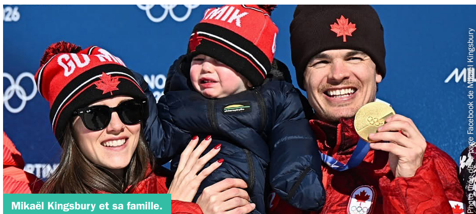
Mikaël Kingsbury et sa famille.

Après deux descentes dans lesquelles elle n'a pas été en mesure d'atterrir de la façon qu'elle l'aurait souhaitée, elle savait qu'elle était capable de mieux faire pour la troisième et dernière descente. Sous le regard de plusieurs membres de sa famille, elle a profité de son dernier passage sur la piste pour signer sa meilleure descente de la journée qui lui a valu 64,73 points. Une note qu'elle n'avait jamais obtenue auparavant en Coupe du monde. Au final, elle prendra le 7 e rang.