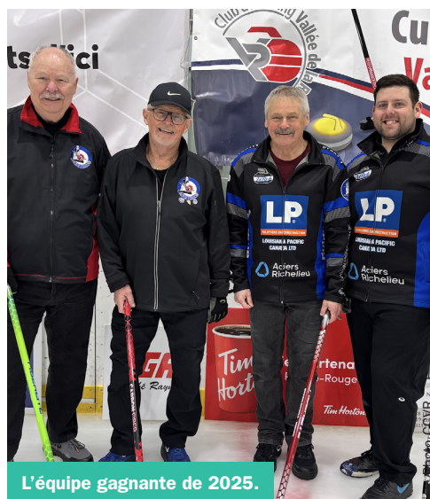
L'équipe gagnante de 2025.