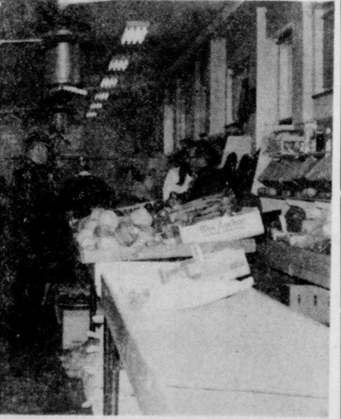
Plusieurs tables avaient été délaissées par leurs locataires habituels, hier et depuis quelques semaines même, l'enthousiasme ne régnait plus chez ces gens.