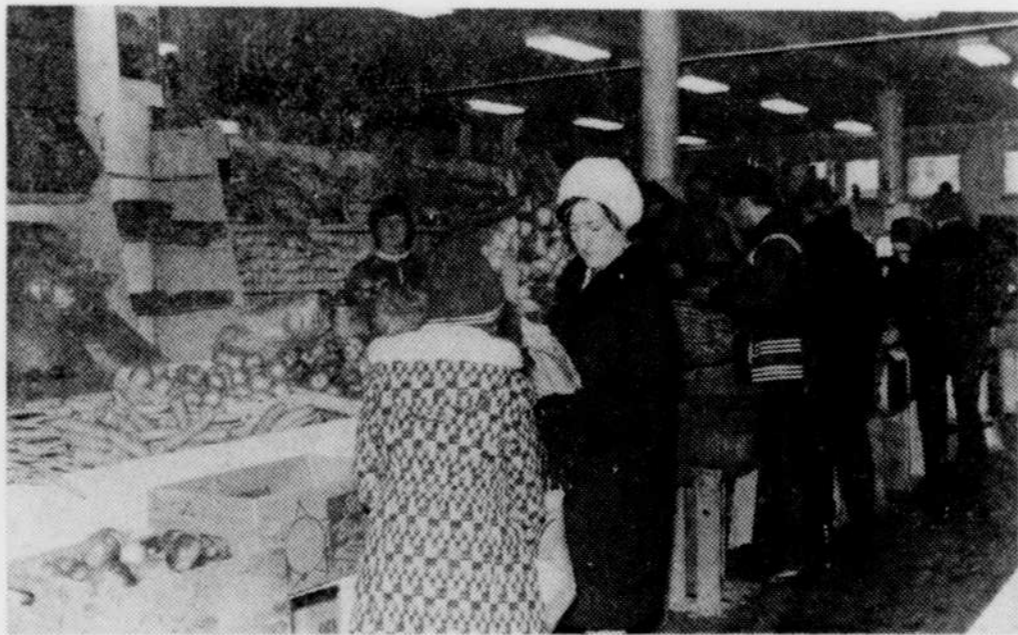
Ainsi qu'en fait foi la présente photo, il y avait néanmoins de l'animation hier, au Marché public, à l'occasion de cette dernière journée de vie du marché.

Et qui sait, la formule traditionnelle du marché public revivra peut-être un jour, si l'on en croit certaines rumeurs!