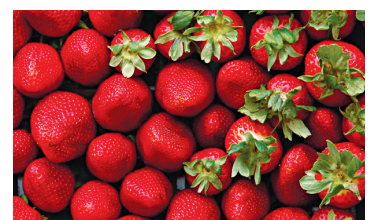
La station Pavlovsk contient plus de 5000 plantes différentes, dont 1000 variétés de fraises seulement.