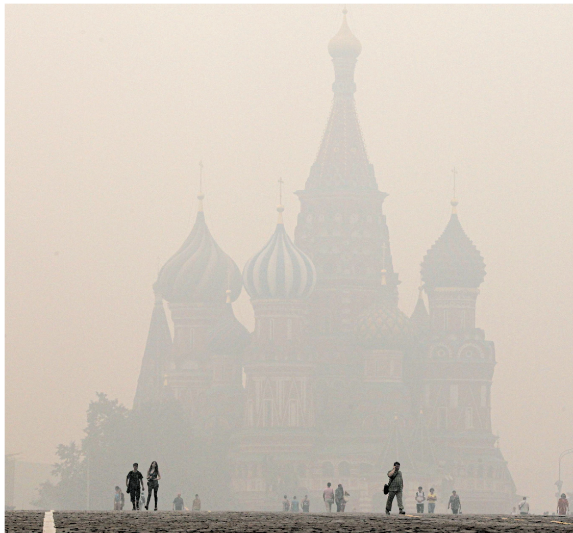
Le smog recouvrait Moscou hier pour la sixième journée consécutive. Dans ce nuage, les concentrations en monoxyde de carbone et en particules toxiques sont deux à trois fois plus élevées que le niveau maximal considéré comme sans danger pour la santé.