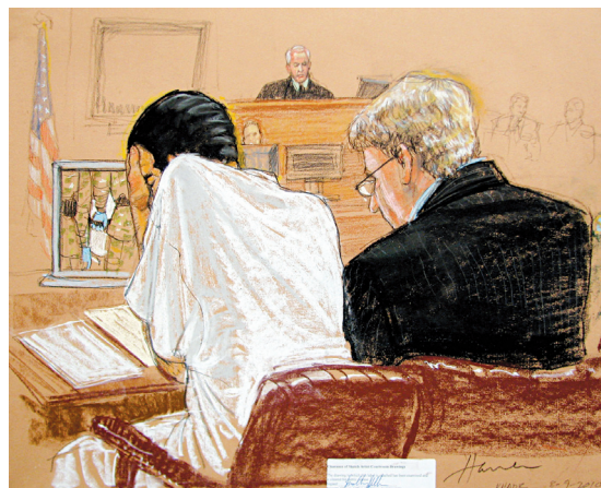
JANET HAMLIN REUTERS