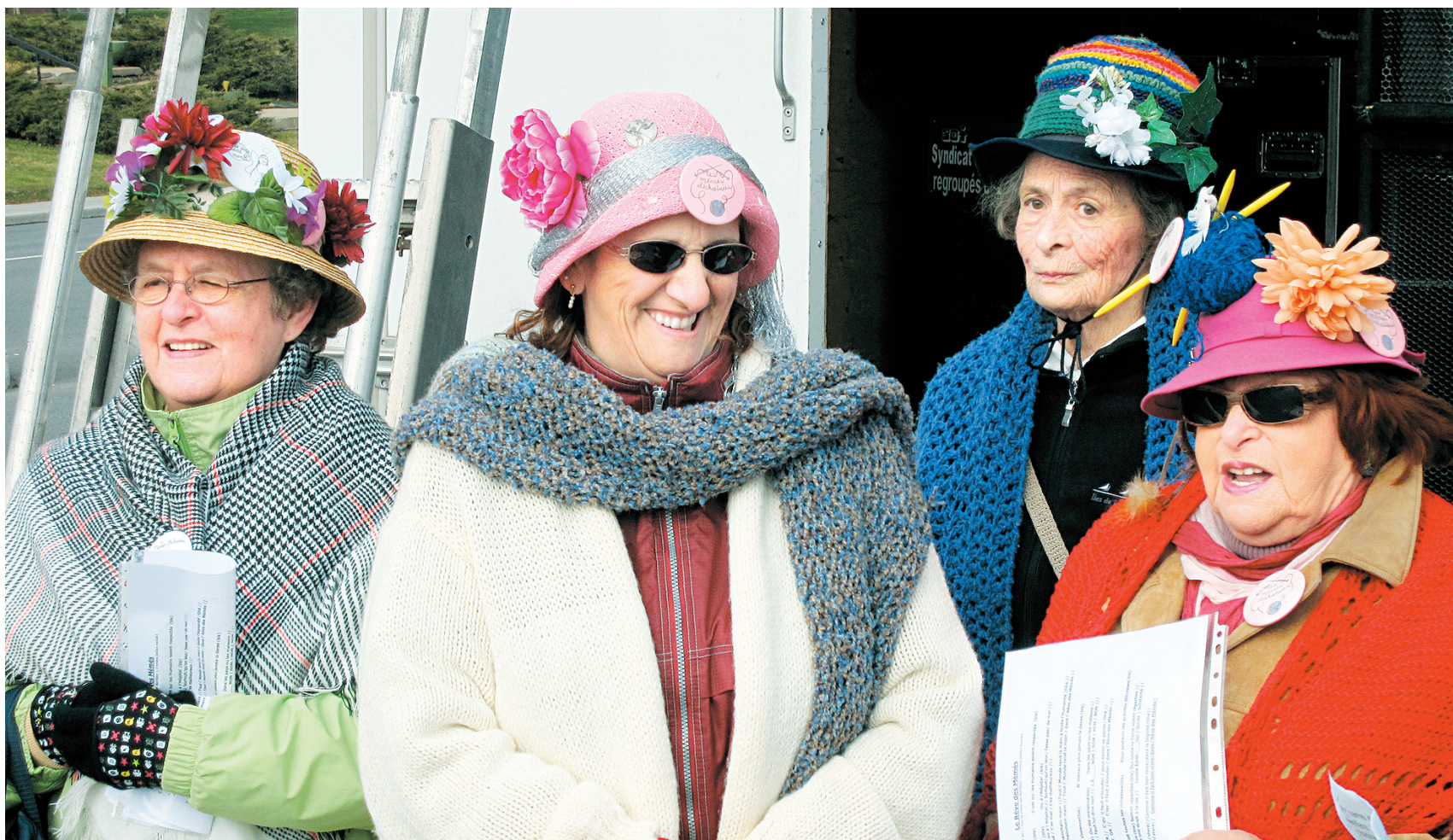
L'engagement social permet aux aînés de combler leurs besoins, de se sentir utiles et de redonner un peu ce qu'ils ont reçu. Les «Mémés déchainées» en sont un des exemples les plus patents.

Pour un trop grand nombre de nos concitoyens, le travail se définit — hélas! — plutôt bien par son origine étymologique: ce mot vient du latin tripalium , qui désigne un instrument de torture.