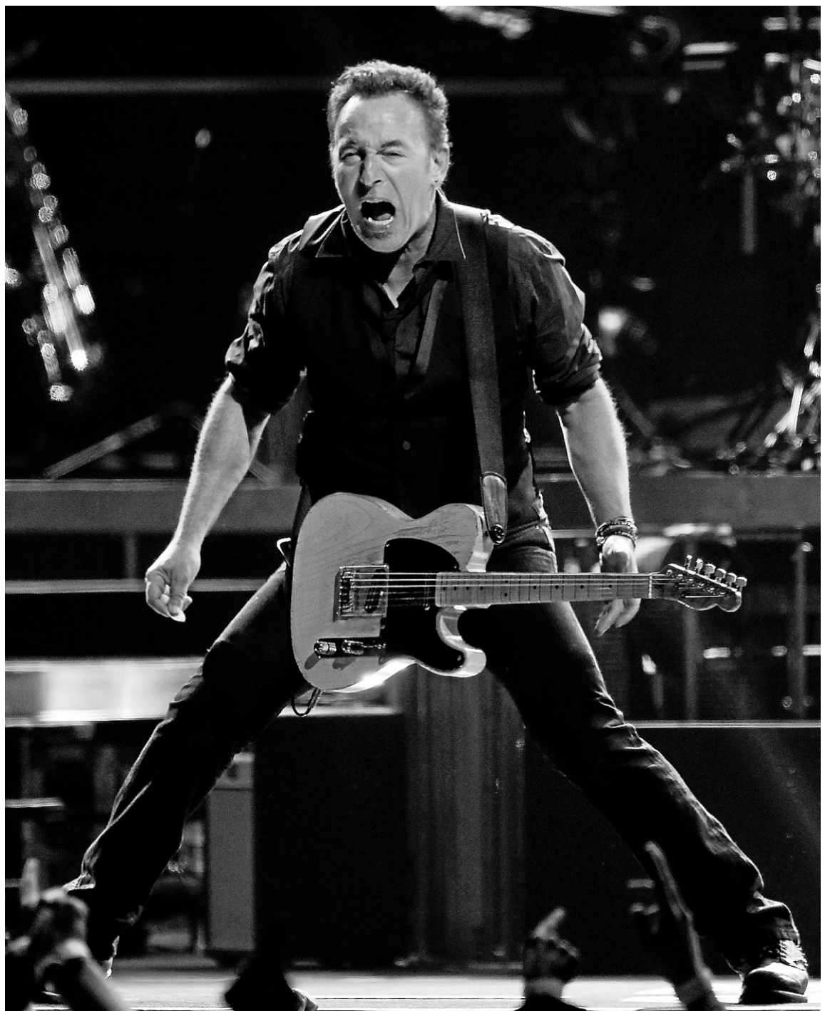
Bruce Springsteen en concert à Boston dans le cadre de sa tournée.

Le Boss a fait référence à quelques reprises, sans les nommer, aux deux musiciens du E Street Band que la mort a fauchés depuis 2008: l'organiste Dan Federici et le saxophoniste format géant, et complice essentiel, Clarence Clemons. Celui-là même dont on a revu