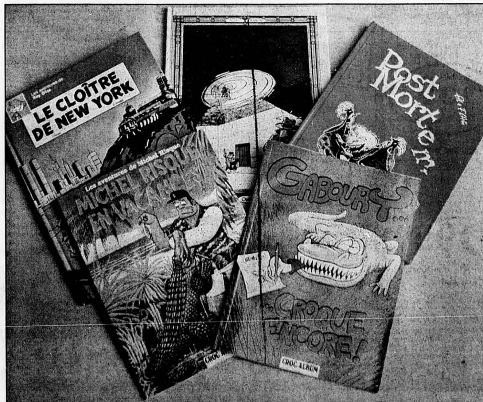
La bande dessinée québécoise a beaucoup de difficulté à faire son chemin, à cause surtout des coûts moins élevés des bandes françaises et américaines.