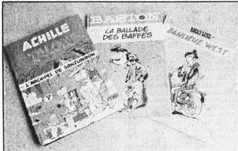
Les ouvrages français bénéficient d'une distribution considérable chez nous.

reau de chômage et s'en va à New York faire de la caricature. Il revient au pays et trouve un poste à l'Office de l'Information en Temps de Guerre, à Ottawa. Puis, en 1944, il se joint à l'équipe du Bulletin des Agriculteurs où on lui demande de créer un héros typiquement québécois pour les 150 000 abonnés.