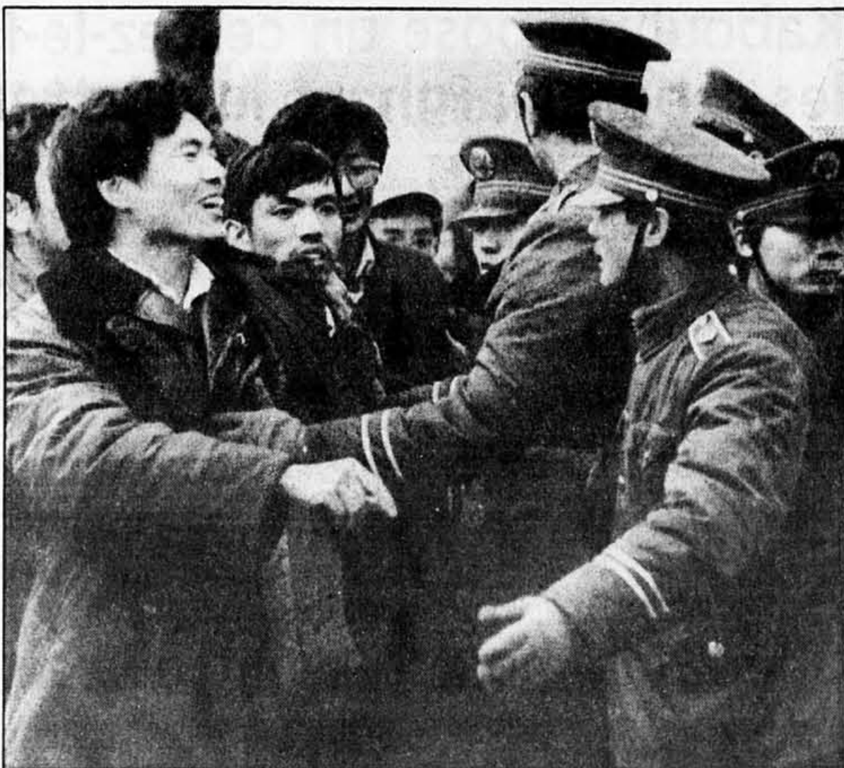
Des policiers chinois repoussent des étudiants qui ont pénétré dans leurs rangs au cours d'une manifestation interdite qui s'est déroulée jeudi sur la place Tiananmen à Pékin.

Une nouvelle réunion entre les négociateurs iraniens et américains a eu lieu à Genève le 8 novembre, sans résultat, toujours selon le Post.