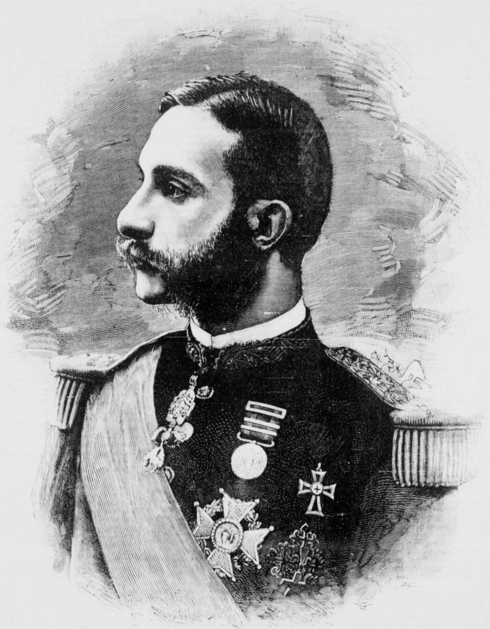
S. M. ALPHONSE XII, roi d'Espagne, de passage à Paris.