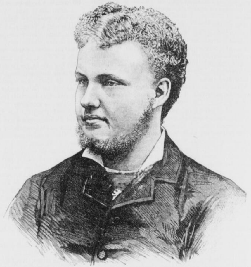
LE PRINCE ROYAL CHARLES DE PORTUGAL D'après la photographie de M. Fillon, à Lisbonne.