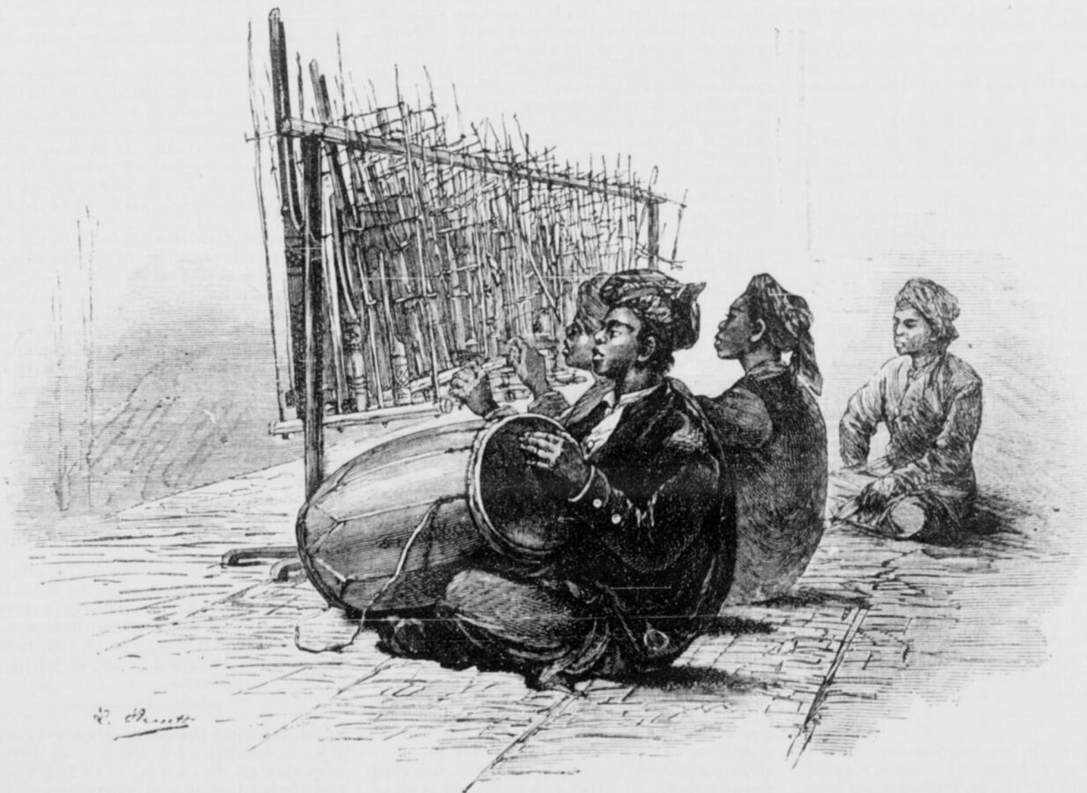
ANGKLONG, INSTRUMENT DE MUSIQUE DE JAVA