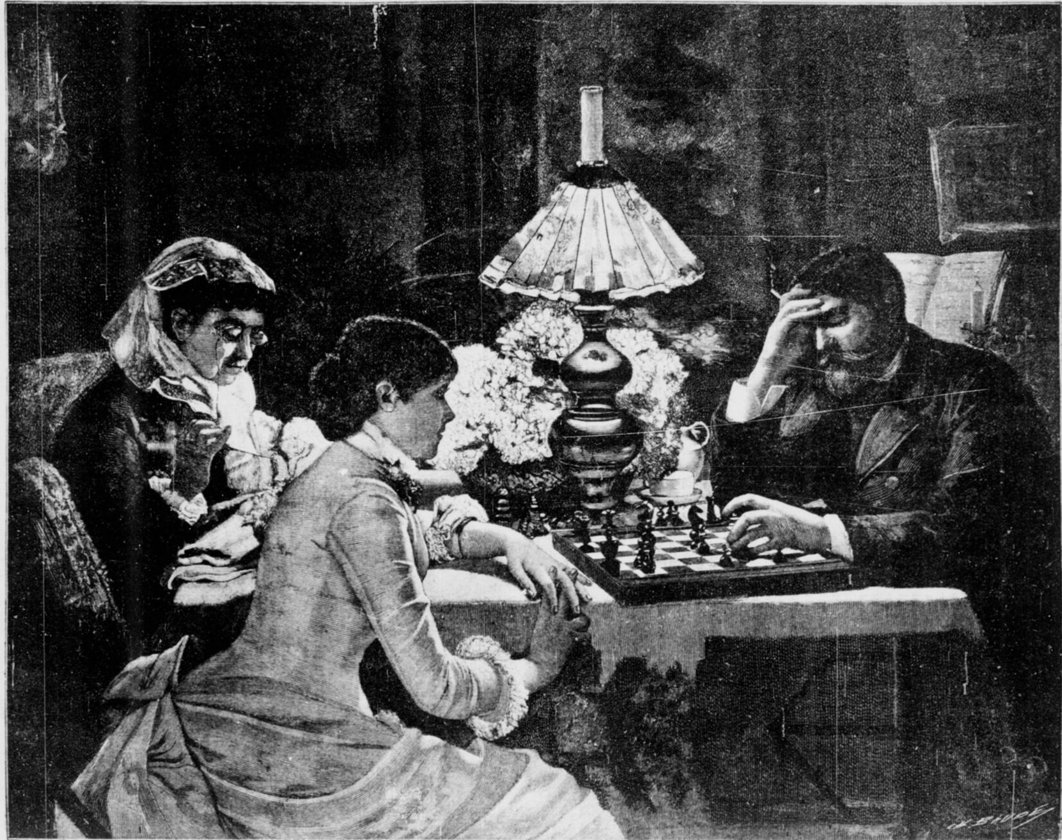
UNE PARTIE D'ÉCHECS SOUS LA LAMPE