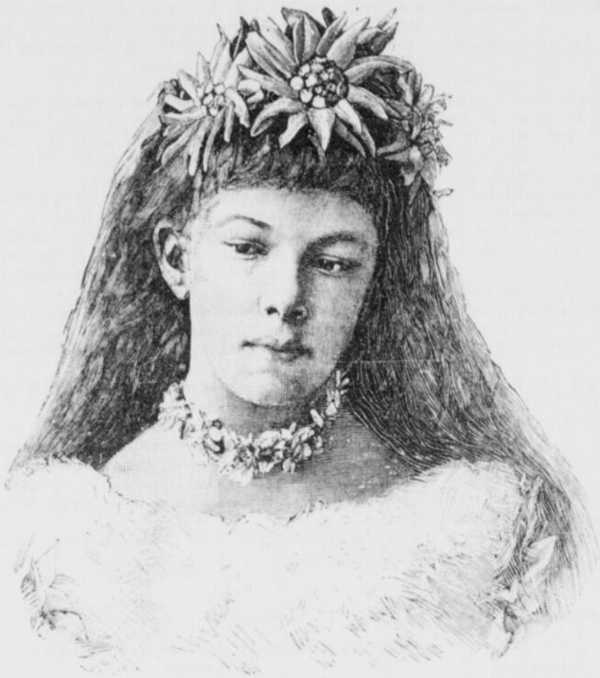
L'ARCHIDUCHESSA MARIE VALERIE D'AUTRICHE