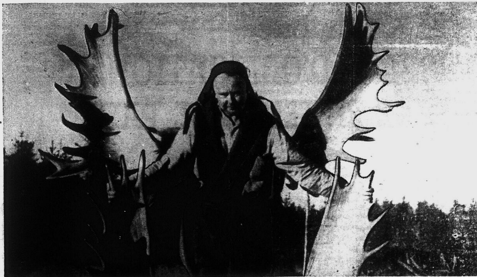
Trophées de chasse à l'original