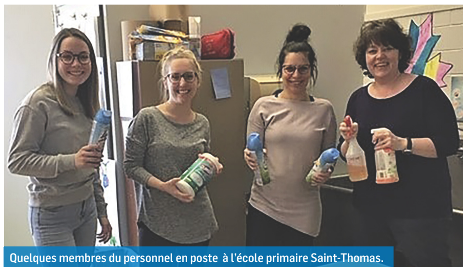
Quelques membres du personnel en poste à l'école primaire Saint-Thomas.

“Évidemment, les parents sont avisés qu'ils ne doivent pas envoyer leurs enfants si ces derniers présentent des symptômes. Les éducatrices tentent de distancer les enfants le plus possible et le concierge désinfecte tous les jours.” rassure Mme Bilodeau.