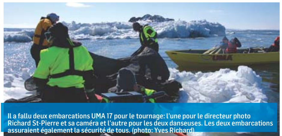
Il a fallu deux embarcations UMA 17 pour le tournage: l'une pour le directeur photo Richard St-Pierre et sa caméra et l'autre pour les deux danseuses. Les deux embarcations assuraient également la sécurité de tous.

Toujours en quête d'inspiration, Mme Caron retournera au Groenland pendant quelques jours en juin: «Le Groenland est magnifique. Les endroits riches en écosystèmes où l'homme n'a pas trop pilasé, ça me nourrit» conclut-elle.