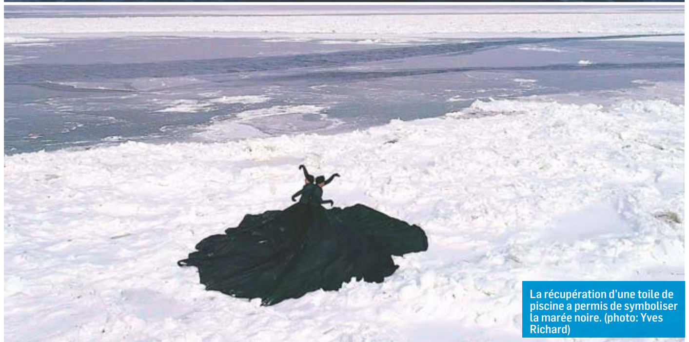
La récupération d'une toile de piscine a permis de symboliser la marée noire.