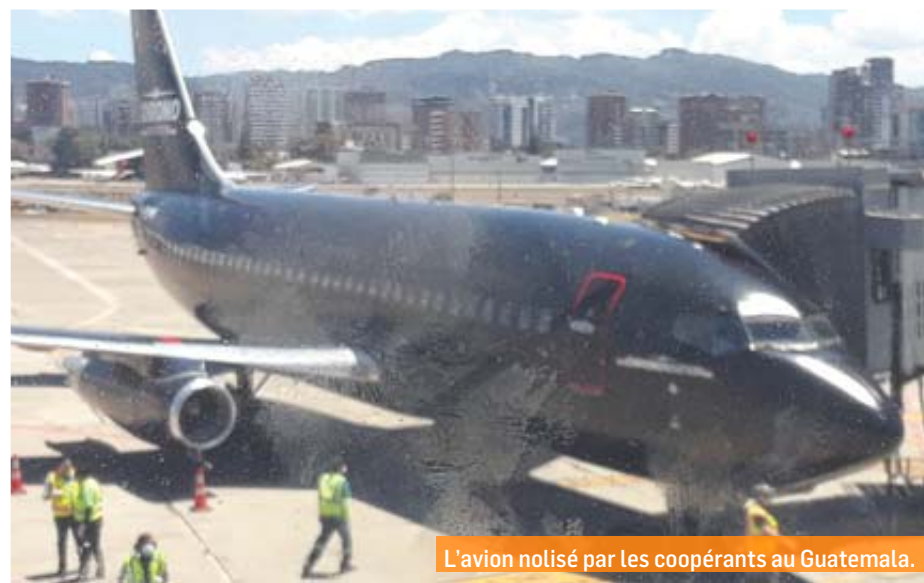
L'avion nolisé par les coopérants au Guatemala.