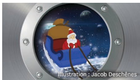
Illustration : Jacob Deschênes