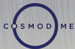
Illustration : Jacob Deschênes

Galerie d'art | Entrée libre Horaire détaillé à blainville.ca