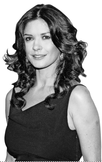
Catherine Zeta-Jones