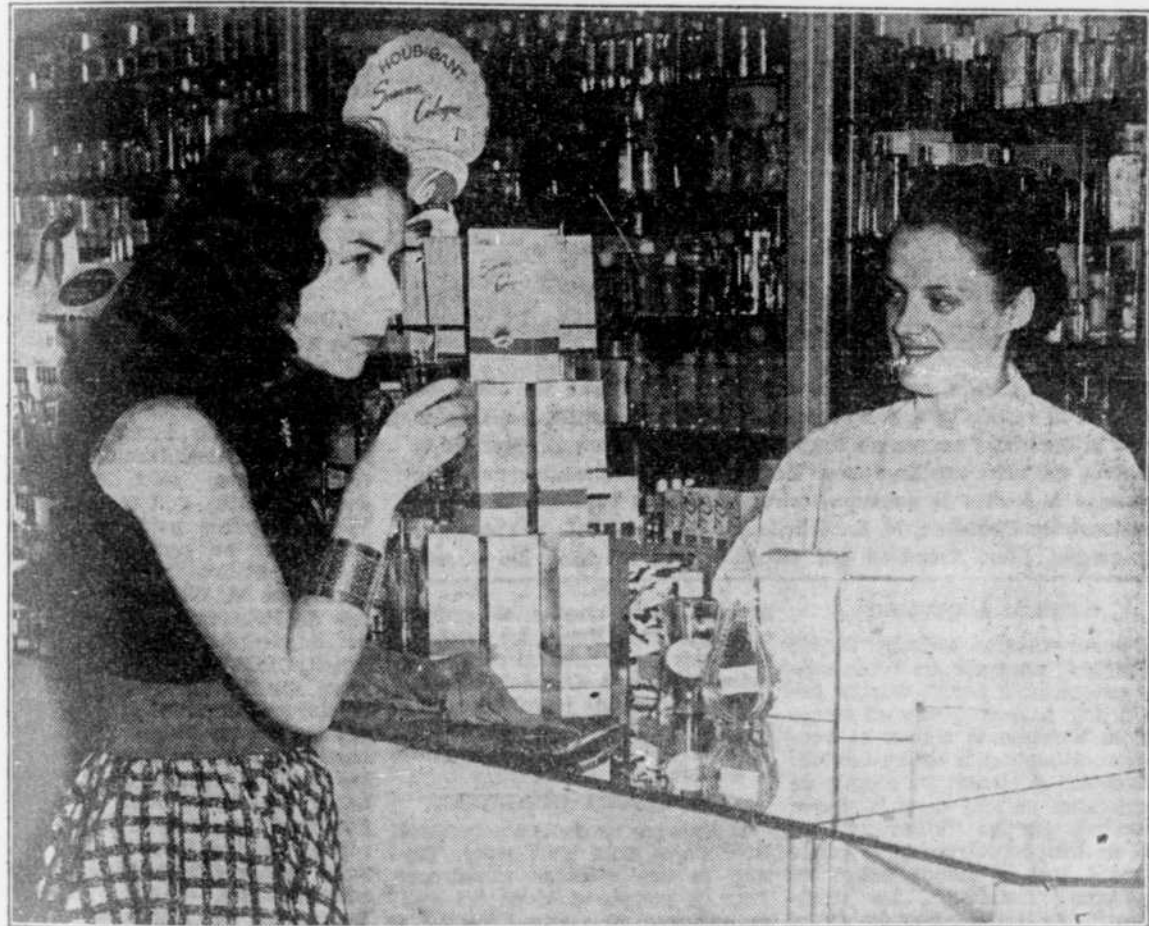
Elle cherche un parfum capiteux qui complètera sa luxurieuse chevelure de brune...

Brahms l'écrivit en 1860, un an après avoir donné, en première audition à Hanovre, son premier concerto pour piano et orchestre.