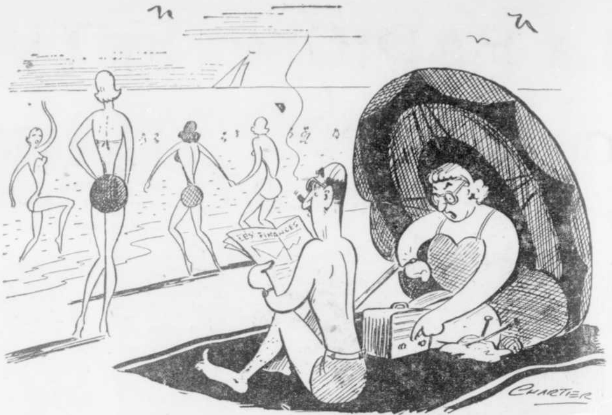
« Mon doux, Téléphore! un peu plus qu'on marquait « LA FEMME, AUJOURD'HUI » (telle que vue par Réjane Desrameaux) »