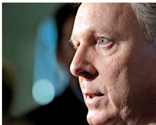
Le premier ministre Jean Charest

Un peu plus tôt en journée, M. Charest avait laissé entendre que le gouvernement Harper devrait prendre exemple sur l'un de ses prédécesseurs conservateurs, Brian Mulroney, dans le domaine de l'environnement. Jean Charest était ministre de l'Environnement sous Brian