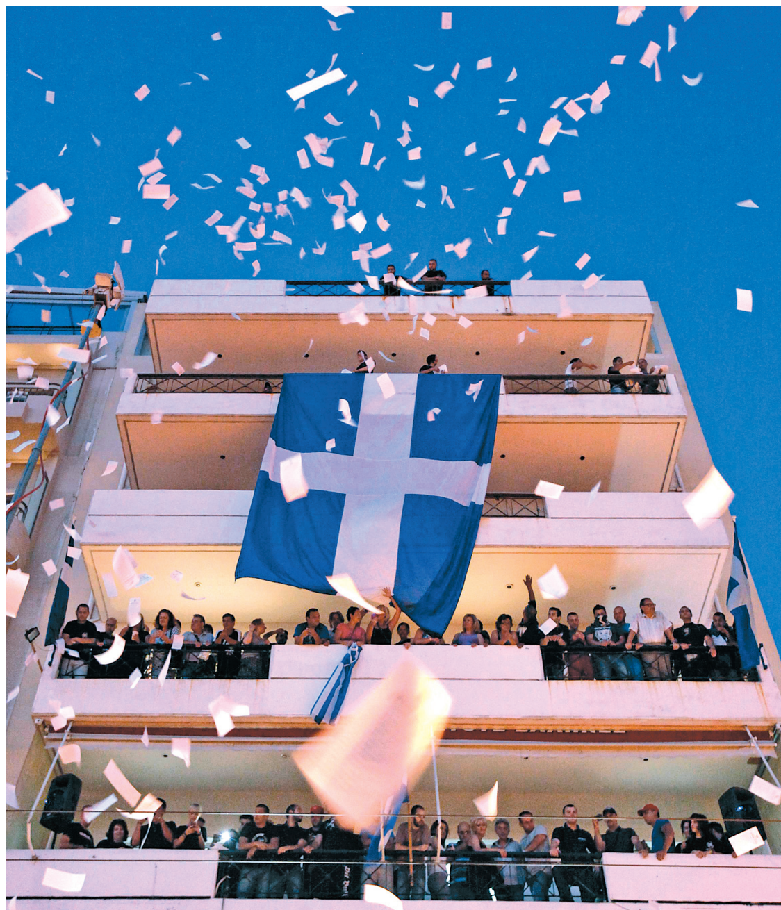
Des partisans du parti Aube dorée célèbrent les résultats des élections dans leur quartier général d'Athènes. Avec 7% des suffrages, les néonazis font leur entrée au Parlement grec.