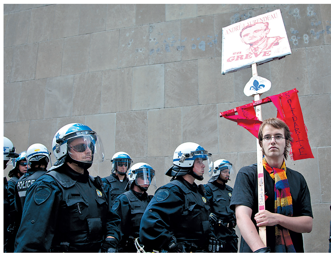
Les associations étudiantes promettent de poursuivre leurs actions et de faire sentir leur présence d'ici l'automne.