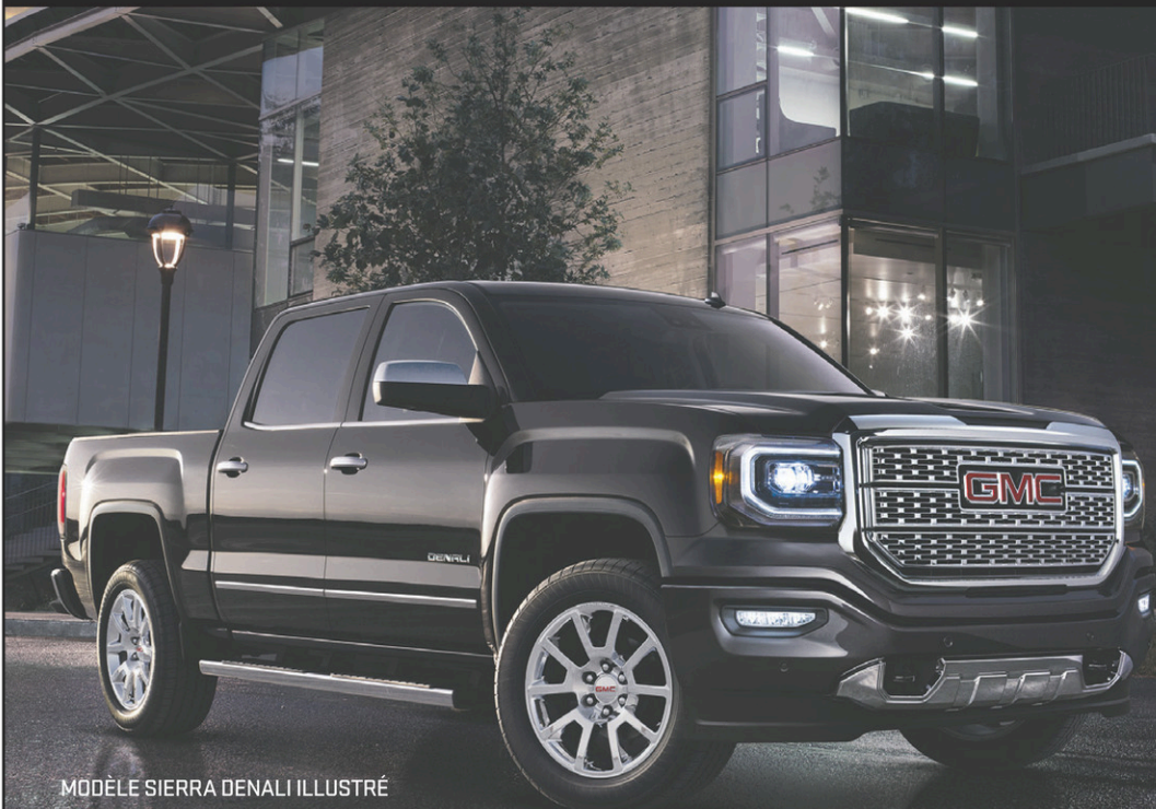
MODÈLE SIERRA DENALI ILLUSTRÉ