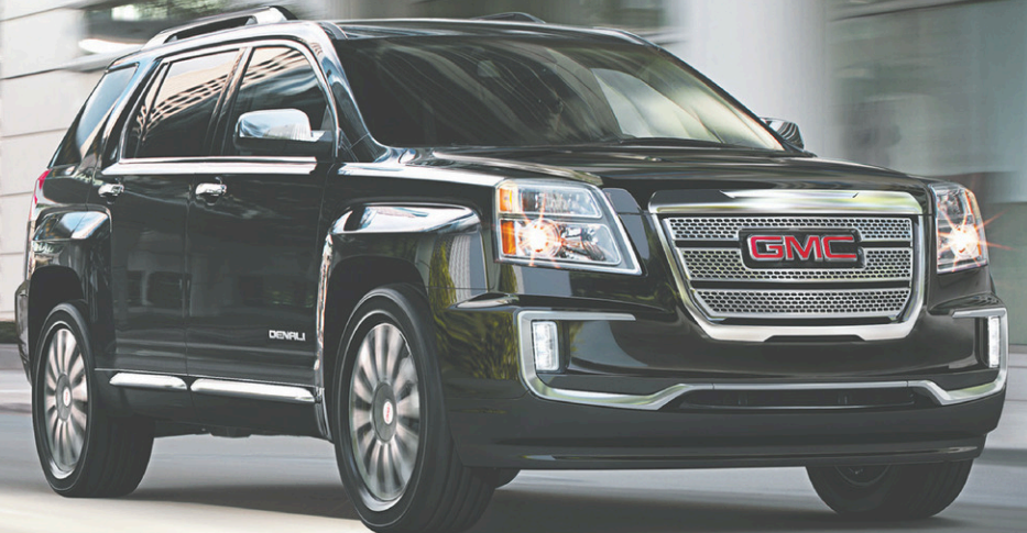
MODÈLE TERRAIN DENALI ILLUSTRÉ

BASÉ SUR UNE LOCATION AUX DEUX SEMAINES À PARTIR DE 154 $. PRIX À L'ACHAT DE 31 113 $. VERSEMENT INITIAL DE 2 800 $. COMPREND 750 $ DE RABAIS À LA LOCATION, 750 $ DE PRIME SUR DEMANDE D'UNE CARTE GM ET LES FRAIS DE TRANSPORT.