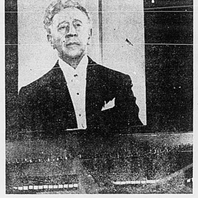
Artur Rubinstein Un pianiste encore important

recital d'abord annoncé pour la mi-octobre. Bref, disons-le: malgré tout, hier soir, Rubinstein nous a encore "eus"!