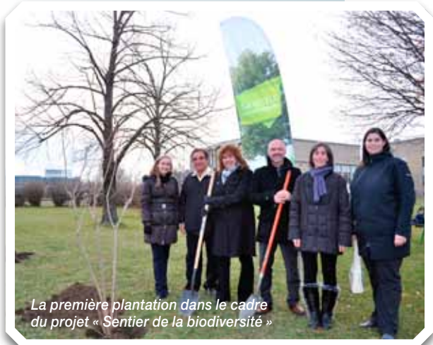
La première plantation dans le cadre du projet « Sentier de la biodiversité »

L'approche retenue par les membres du comité environnement vise la participation de plusieurs départements du Cégep afin de maximiser les retombées d'éducation en environnement du projet. Les Départements de graphisme, de sciences de la nature, d'arts et lettres et d'arts plastiques représentent un excellent potentiel pour la mise en valeur de la participation des étudiants. Les étudiants d'un cours en Art et environnement ont d'ailleurs déjà réalisé plusieurs maquettes d'aires de repos à leur image dont quelques-unes seront sélectionnées pour être réalisées à des endroits stratégiques du sentier.