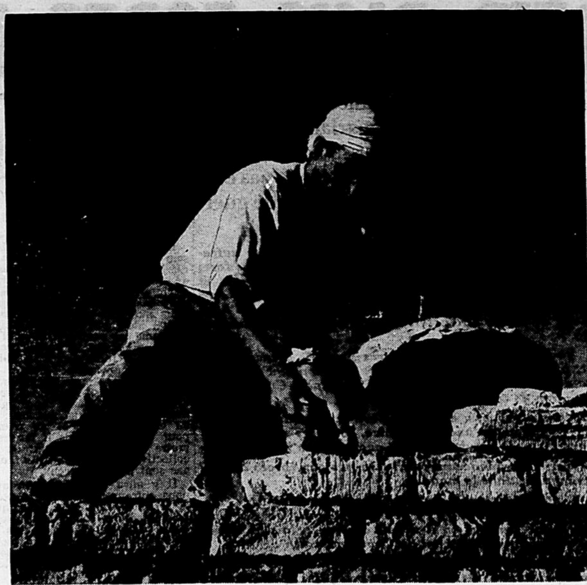
EN PALESTINE, l'Office de secours et de travaux des Nations Unies collabore avec les gouvernements intéressés à l'amélioration du sort de centaines de milliers de réfugiés arabes. Dans le désert de Jéricho, des Arabes construisent leur propre village, selon un projet de l'Office.