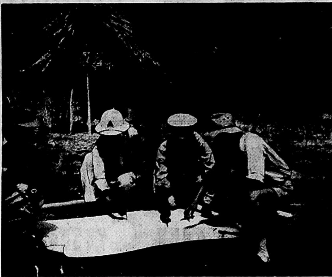
LES NATIONS UNIES ont commencé en 1950 à mettre en application leur programme élargi d'assistance technique. La mise en valeur des ressources des pays sous-développés exige la coopération d'experts dans tous les domaines. Ci-dessus, des spécialistes de l'irrigation.