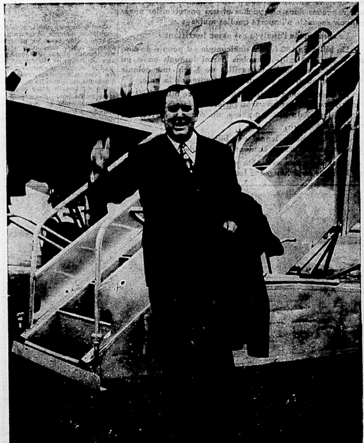
L'ETABLISSEMENT d'une paix durable dépend, en grande partie, d'une amélioration des rapports entre l'Est et l'Ouest. M. Trygve Lie, Secrétaire général, a présenté à cet effet dans les capitales des Quatre Grands un plan de paix en dix points. Ci-dessus: M. Trygve Lie arrive à Paris.