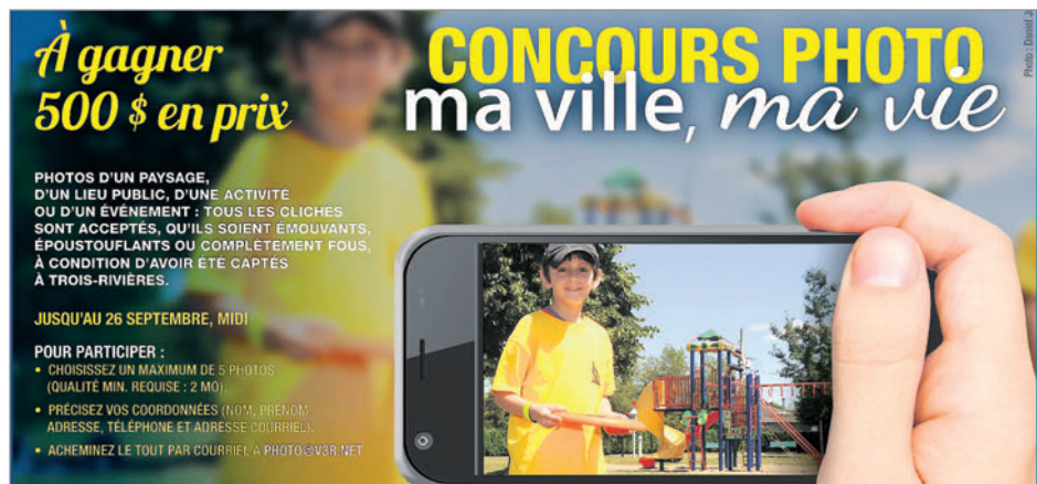
C'est le temps de sortir vos appareils photo et de prendre le meilleur cliché.