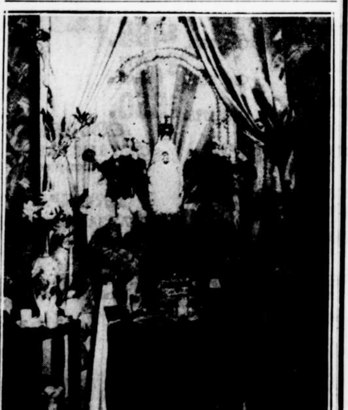
N.-Dame-du-Cap, à East Angus — La statue de Notre-Dame-deux semaines, dans les familles d'East Angus, un itinéraire fixé chaque dimanche. Chaque famille reçoit solennellement la statue pendant 24 heures lui prépare une place d'honneur, et toute la famille récite devant la Madone de nombreux chapelets. La visite se termine le matin, à l'église, alors que tous les membres de la famille s'approchent des sacrements.