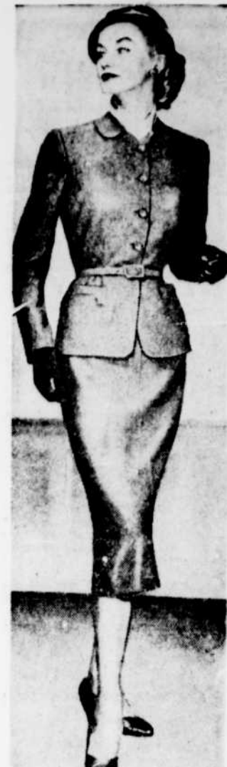
Ce tailleur de léger linage citrouille est l'article idéal pour porter sous votre manteau de fourrure, qu'il soit brun, gris ou noir. De ligne très simple et amincissante son chic est incontestable.