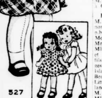
PATRON No 527 - Cette poupée mesure 32 pouces et possède des bras et des jambes mobiles ainsi que des cheveux qui peuvent onduler. Les explications sont en anglais seulement. Ces patrons se vendent 40 cent.