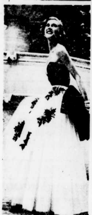
Femme fatale ou toute jeune fille, la mode 1951-52 vous permet de vous habiller avec goût, tout en donnant libre cours à votre imagination. Le modèle du haut est une création Jean Dessès. La robe du bas allie le tulle au velours noir.