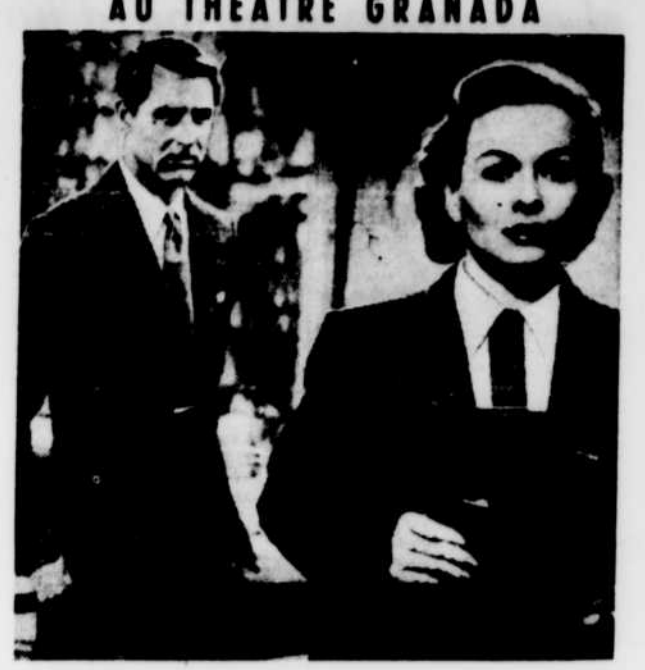
Cary Grant, dans le rôle d'un docteur amoureux dans le film "People Will Talk", donne quelques conseils qui semblent difficiles à accepter par la patiente Jeanne Crain. Ce couple partage les honneurs de la comédie sociale du producteur Darryl F. Zanuck et du compositeur Joseph L. Mankiewicz. "People Will Talk" prendra l'affiche du théâtre Granada à partir de demain.