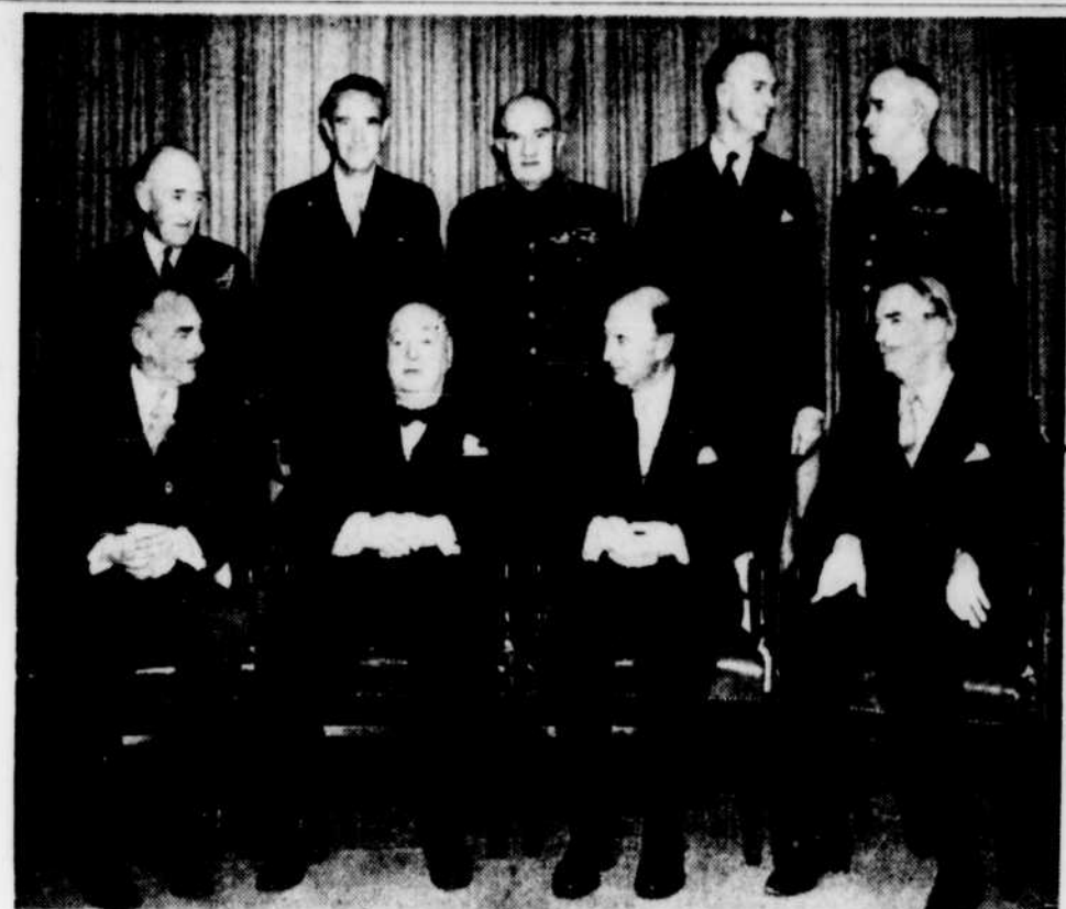
Churchill au Pentagone de Washington — Le premier ministre Winston Churchill assiste à une réunion des chefs militaires et diplomatiques de l'Angleterre et des Etats-Unis.