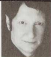
Robert Lepage