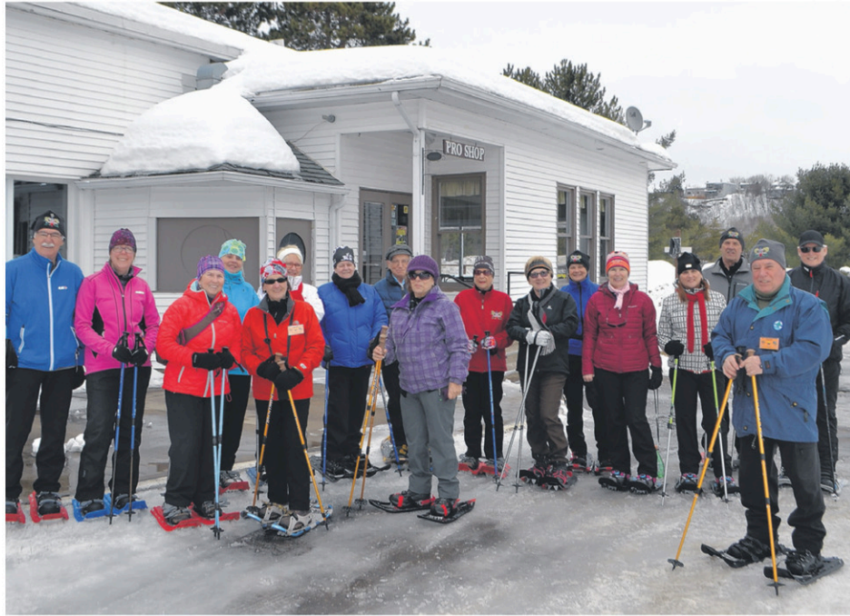
On voit les amateurs de raquettes qui ont pris part à la dernière randonnée au Club de golf.