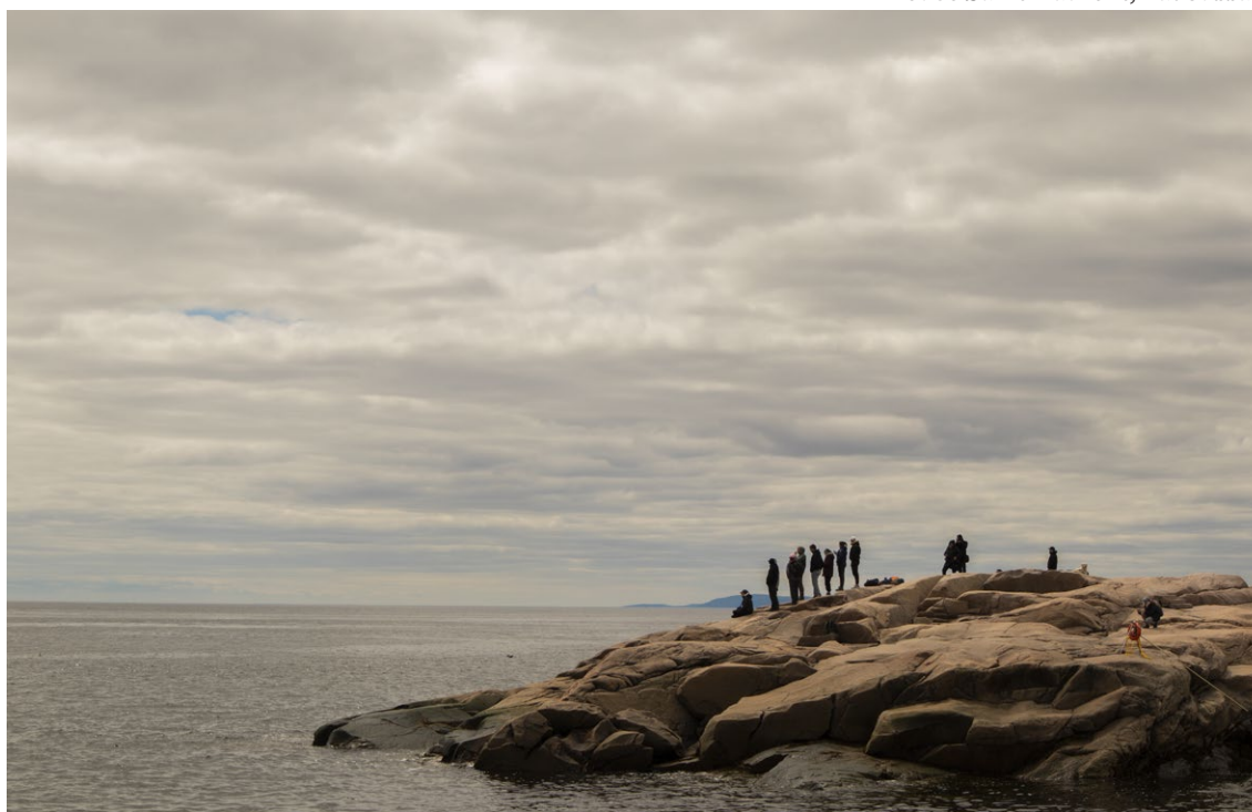
Fleuve Saint-Laurent, Tadoussac

œil sur la rivière Muteshekau-shipu (le nom innu de la Magpie) à cause de son débit puissant, parfait pour l'instauration d'un barrage hydro-électrique. La rivière possède pourtant un moyen de défense : la population. Les communautés autochtones, les amateur-trice-s de sports d'eaux vives et certains groupes citoyens et environne-