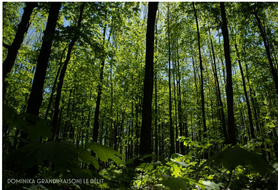
DOMINIKA GRANDMAISON | LE DÉLIT

rapide de la biodiversité, etc. Être réaliste nécessite de parler de la crise en ayant en tête les avancées technologiques écologiques, les populations qui acquièrent une conscience environnementale et les découvertes scientifiques