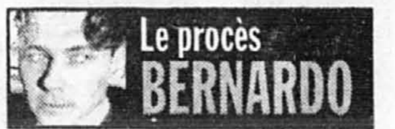
Le procès BERNARDO

Les vidéos montreraient également le viol de Tammy Homolka, 15 ans, par Paul Bernardo et son ex-femme, Karla Homolka. Ceux-ci auraient d'abord drogué