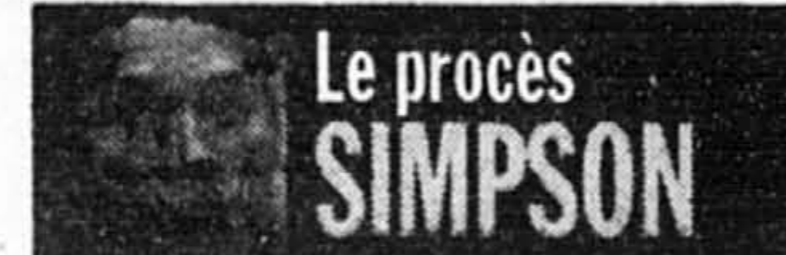
Le procès SIMPSON

Le juge Lance Ito avait déjà empêché les avocats de Simpson la semaine dernière de verser au dossier la déclaration de leur client lorsque l'expert en ADN