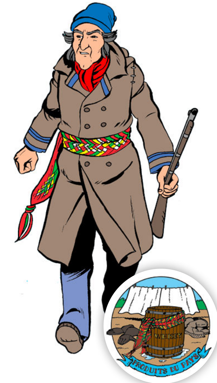
ILLUSTRATIONS : JOCELYN JALETTE

Le fléchage, la technique de réalisation d'une ceinture fléchée, est reconnue au patrimoine culturel immatériel du Québec, au même titre que les contes et les légendes, la musique, les