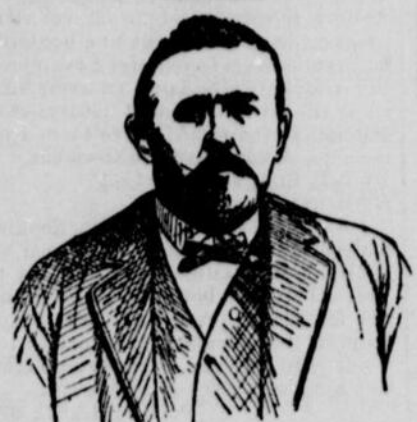
M. EMERY HARROTTE

Les Pilules Moro contiennent les ingrédients qui vous guériront des maux de reins dont vous souffrez et qui, prises à la dose de deux après chaque repas, vous mettront aussi souple que jamais.