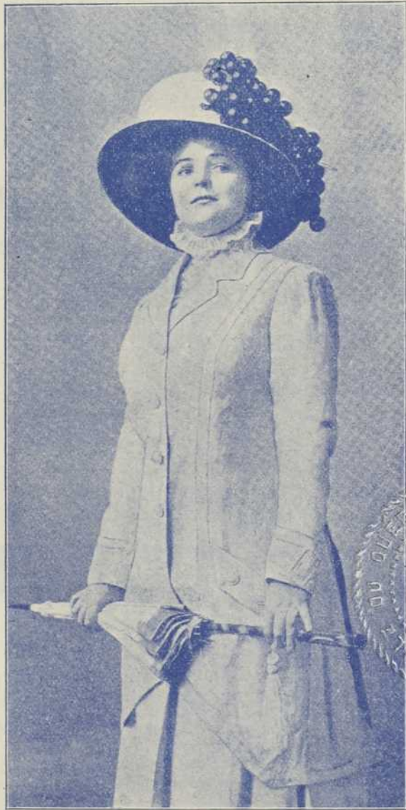
Le grand chic