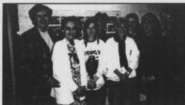
Conseil d'orientation de l'école St-Joachim