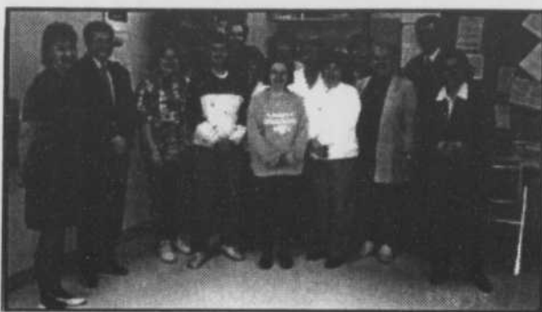
Conseil d'orientation de l'école La Mennais