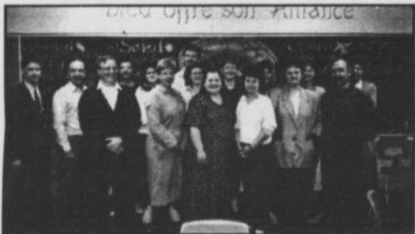
Conseil d'orientation de l'école Bernard-Corbin