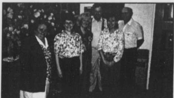
Conseil d'orientation de l'école Notre-Dame