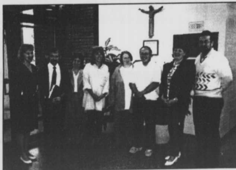
Conseil d'orientation de l'école secondaire Armand-Corbeil