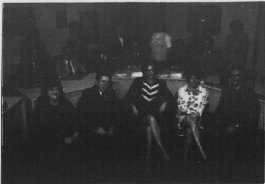
Les membres du Conseil des commissaires apportent une attention toute particulière au respect des biens publics, nouveau volet du projet éducatif général «Une école exigeante et valorisante».