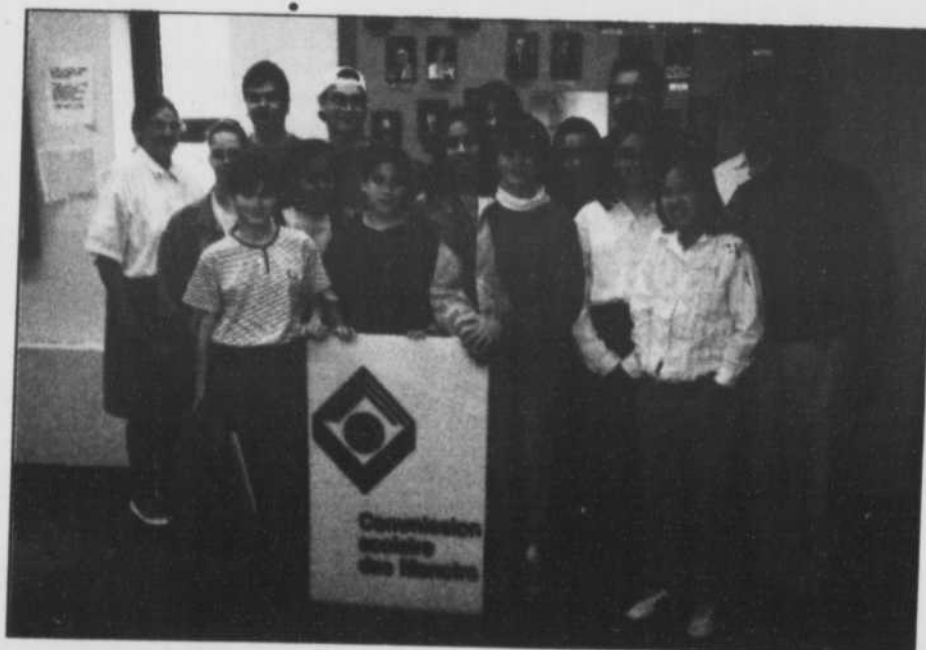
Groupe d'élèves de 6 e année et du secondaire consultés lors des audiences publiques «Une école exigeante et valorisante» et sur le respect des biens publics.