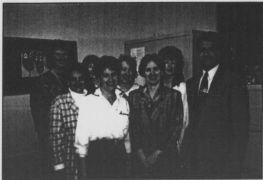
Comité d'orientation du Centre l'Avenir

Les adultes du territoire profitent de services de formation générale et de formation professionnelle qui leur permettent de répondre à leur besoin de développement ou d'améliorer leurs conditions de vie.