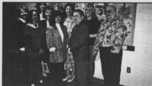
Conseil d'orientation de l'école des Hauts-Bois