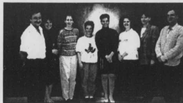
Conseil d'orientation de l'école du Soleil-Levant