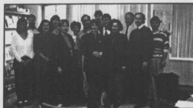
Conseil d'orientation de l'école Le Castelet