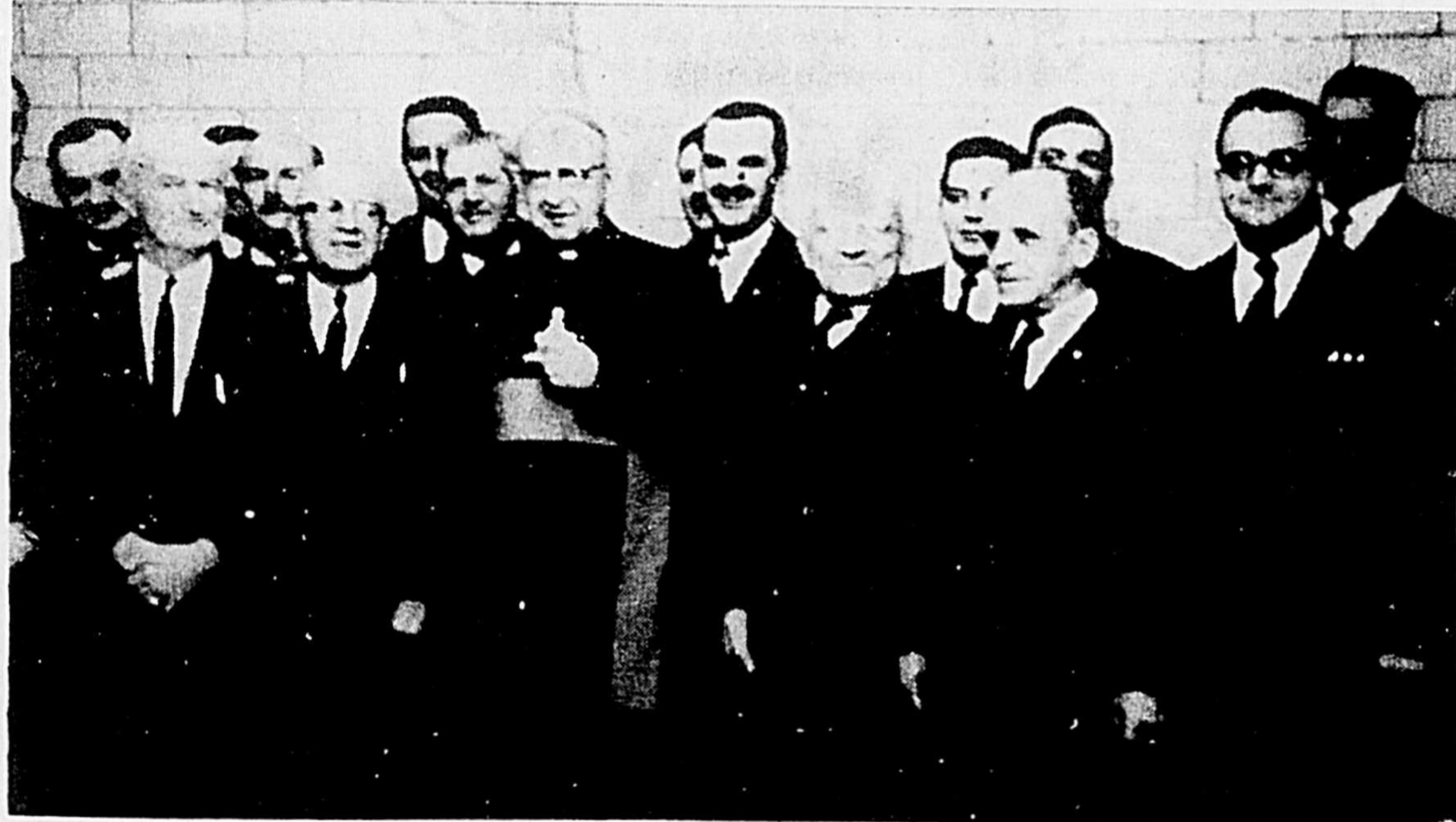
Une partie du groupe des médecins attachés à l'hôpital St-Eusèbe de Joliette qui ont assisté, selon la tradition, à la messe annuelle des mé-