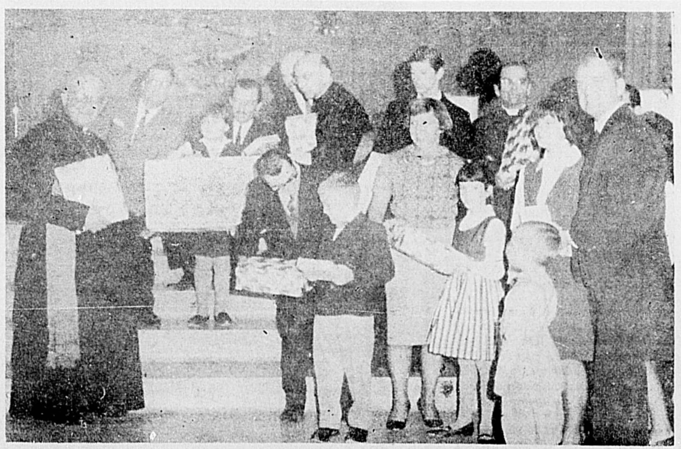
LES ORPHELINS REÇOIVENT AUSSI LEURS ETRENNES