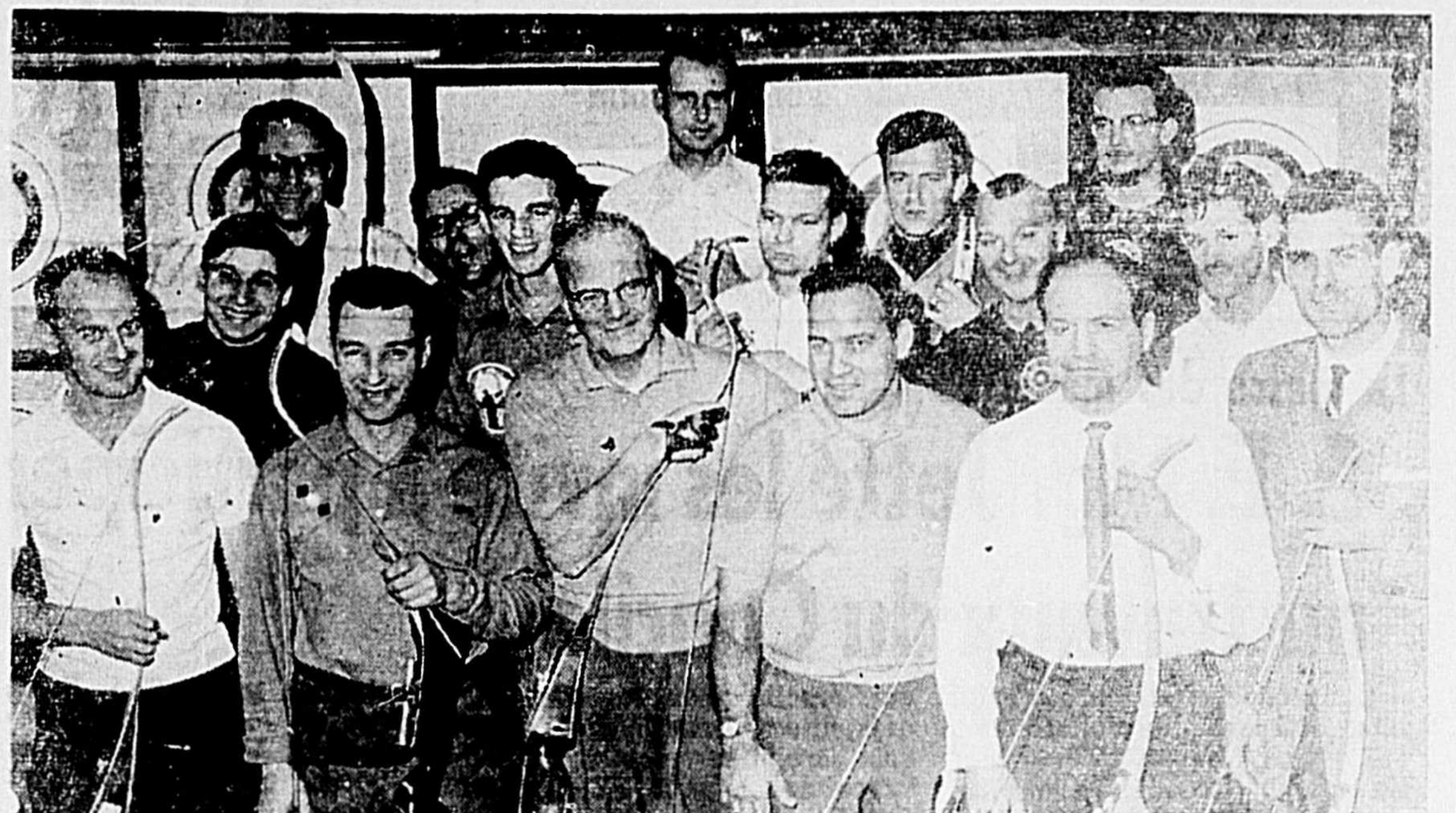
LES PARTICIPANTS AU TOURNOI DE TIR A L'ARC DE LA "RAMPE SPORTIVE"