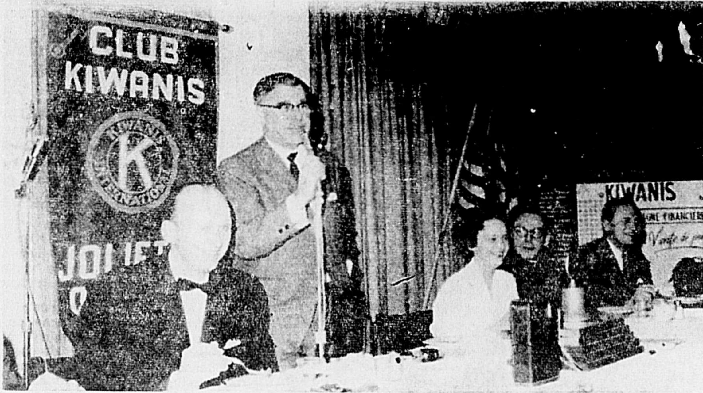
LE KIWANIS RECOIT LES CHANTEURS DE LA PLACE BOURGET