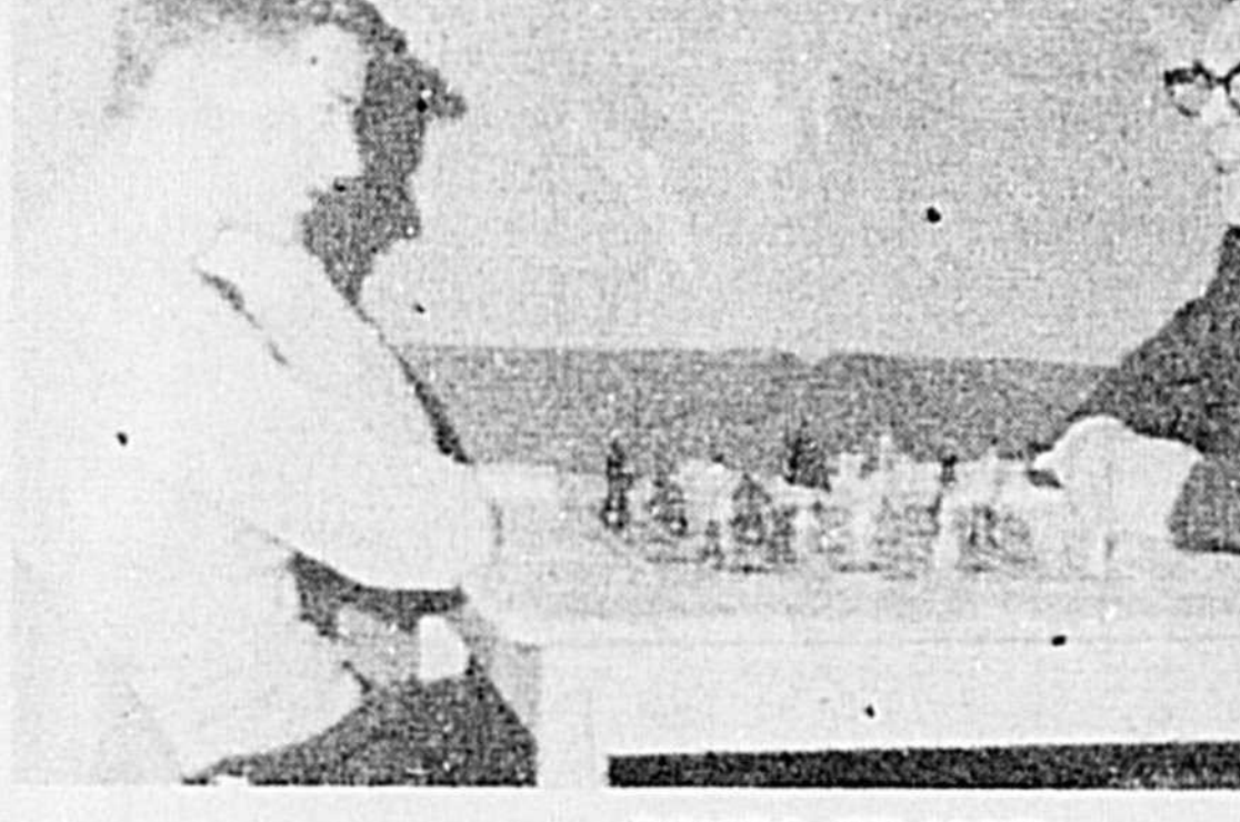
ECHEC ET MAT

Les seize archers se sont qualifiés samedi soir dernier, le 26 décembre, lors d'une ronde éliminatoire à la salle de tir à l'arc du Centre récréatif du Séminaire.