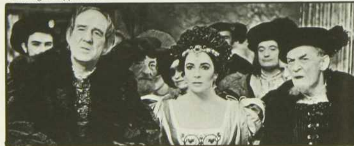
«La Mégère apprivoisée»

Un riche marchand de Padoue a deux filles à marier, mais l'aînée, Catharina, est une véritable mégère. Les prétendants affluent pour la cadette qui ne peut pourtant se marier avant sa soeur. L'un d'eux persuade un ami, Petruccio, gentilhomme ruiné de Vérone, de faire la cour à Catharina. Celle-ci se laisse difficilement gagner mais consent enfin au mariage. La cérémonie terminée, Petruccio entreprend de briser le caractère de sa femme. Il y réussit si bien qu'au mariage de sa soeur, Catharina se montre la plus obéissante des épouses.