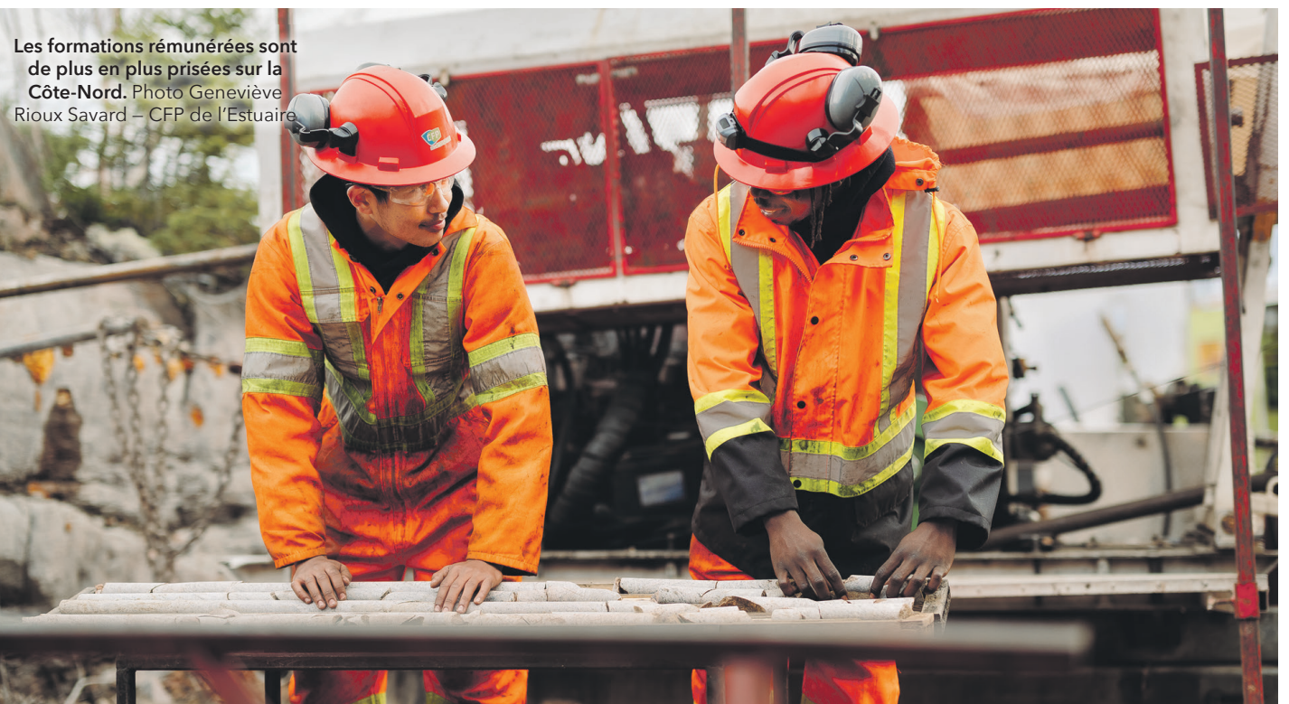
Les formations rémunérées sont de plus en plus prisées sur la Côte-Nord.

Pour démarrer une cohorte, un minimum de trois entreprises partenaires est requis. Les participants reçoivent une rémunération de 25 $ de l'heure, à raison de 40 heures par semaine.