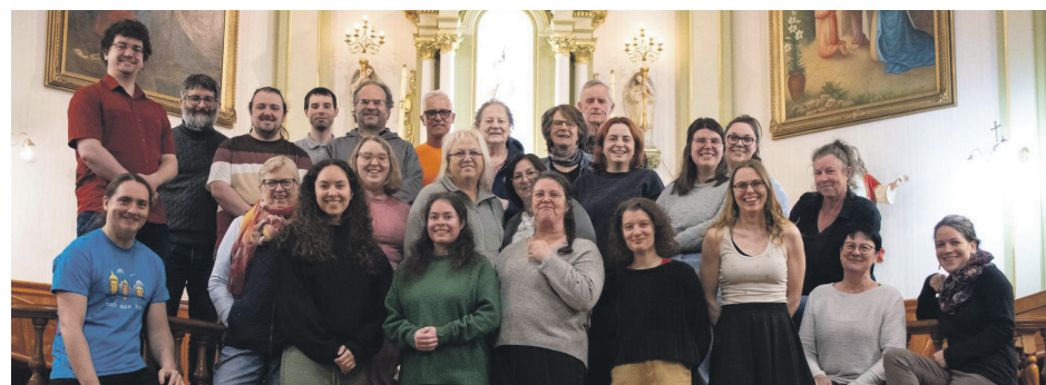
Quiconque voulant faire partie de la chorale pourra y assister lors des séances de répétition du mois de janvier.

«Ce qui est important pour les chefs lors d'une soirée portes ouvertes et les premières répétitions, c'est que les gens se placent avec la hauteur de leur voix et qu'ils se sentent à l'aise