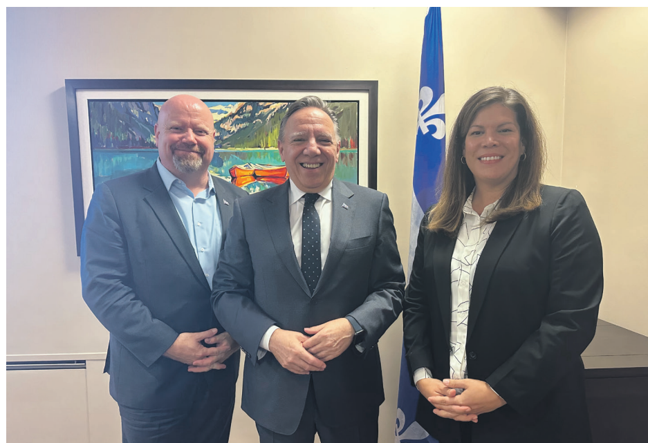
Le ministre Ian Lafrenière, le premier ministre François Legault, et la ministre Kateri Champagne Jourdain, le 20 septembre 2024, à Baie-Comeau.

En regard de la transition politique à venir, le conseil espère un changement de méthode. Le CMDP réitère l'importance d'une adaptation aux réalités régionales. «Les soins doivent être régionalisés, adaptés aux réalités propres à chaque territoire, et non