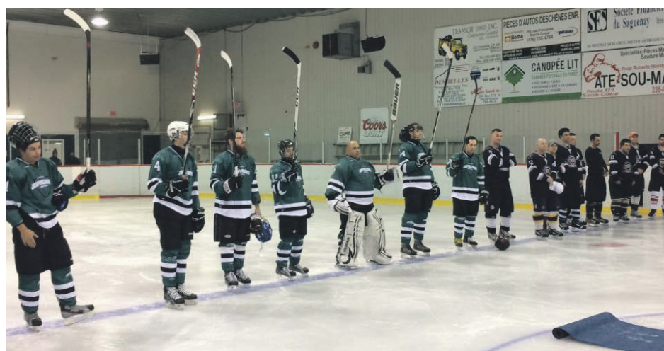
La coupe Sébastien Gauthier sera de retour les 30 et 31 janvier à l'aréna de Sacré-Cœur.