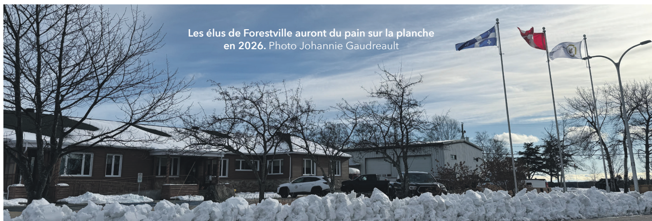
Les élus de Forestville auront du pain sur la planche en 2026.

Forestville amorce 2026 avec une feuille de route bien remplie. Sans mettre de côté les enjeux quotidiens touchant l'ensemble des services municipaux, plusieurs dossiers structurants occuperont une place centrale au cours des prochains mois.