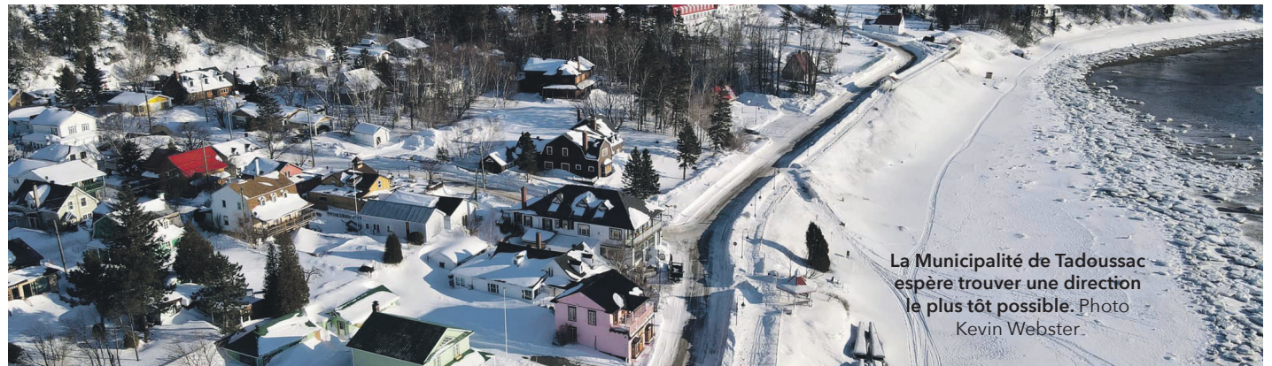
La Municipalité de Tadoussac espère trouver une direction le plus tôt possible.

Par contre, il indique que la Municipalité a engagé une consultante pour