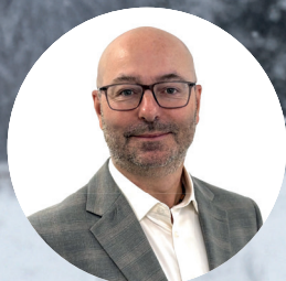
Martin Thomas Éditeur

VOTRE ÉQUIPE LOCALE DE JOURNALISTES DÉVOUÉS SUR LE TERRAIN.