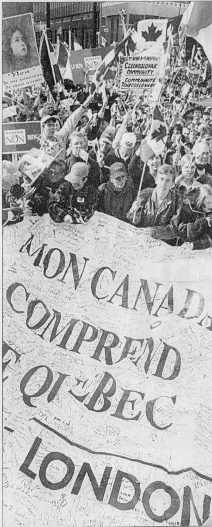
Des dizaines de milliers de personnes ont participé hier au rassemblement du camp du NON au centre-ville de Montréal. En présence du premier ministre Jean Chrétien, du chef du camp du NON Daniel Johnson et du chef du Parti conservateur Jean Charest, les manifestants, dont certains venaient de autres provinces canadiennes, ont lancé un appel à l'unité du Canada.