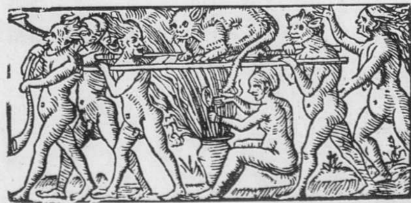
TIRÉ DE MAGIE ET SORCELLERIE EN EUROPE, ÉDITIONS ARMAND COLIN Sorcières transportant un énorme chat (Zentralbibliothek, Zurich).

La participation active de Bodin aux débats sur la sorcellerie pour justifier la plus stricte répression de cette hérésie suprême suffit presque à elle seule à dégonfler le mythe qui fait de la chasse aux sorcières la simple résultante des comportements «arriérés» de rustres personnages des ténèbres médiévales. Cette représentation populaire ne peut en effet résister au travail minutieux mené par les historiens sur la sorcellerie, particulièrement depuis une trentaine d'années, alors que ce champ d'étude a véritablement acquis ses lettres de noblesse.