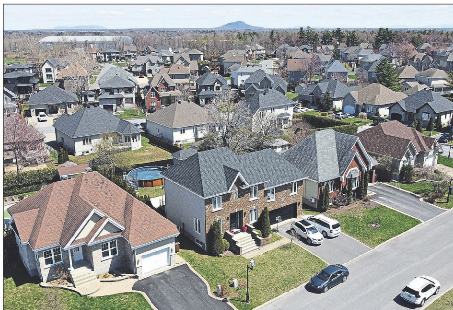
Le prix médian des résidences unifamiliales a augmenté de 19% pour se chiffrer à 506 000$.

Quant au nombre de résidences unifamiliales à vendre, il y en avait 128 en date du 31 mai. S'il s'agit d'une hausse de 5%