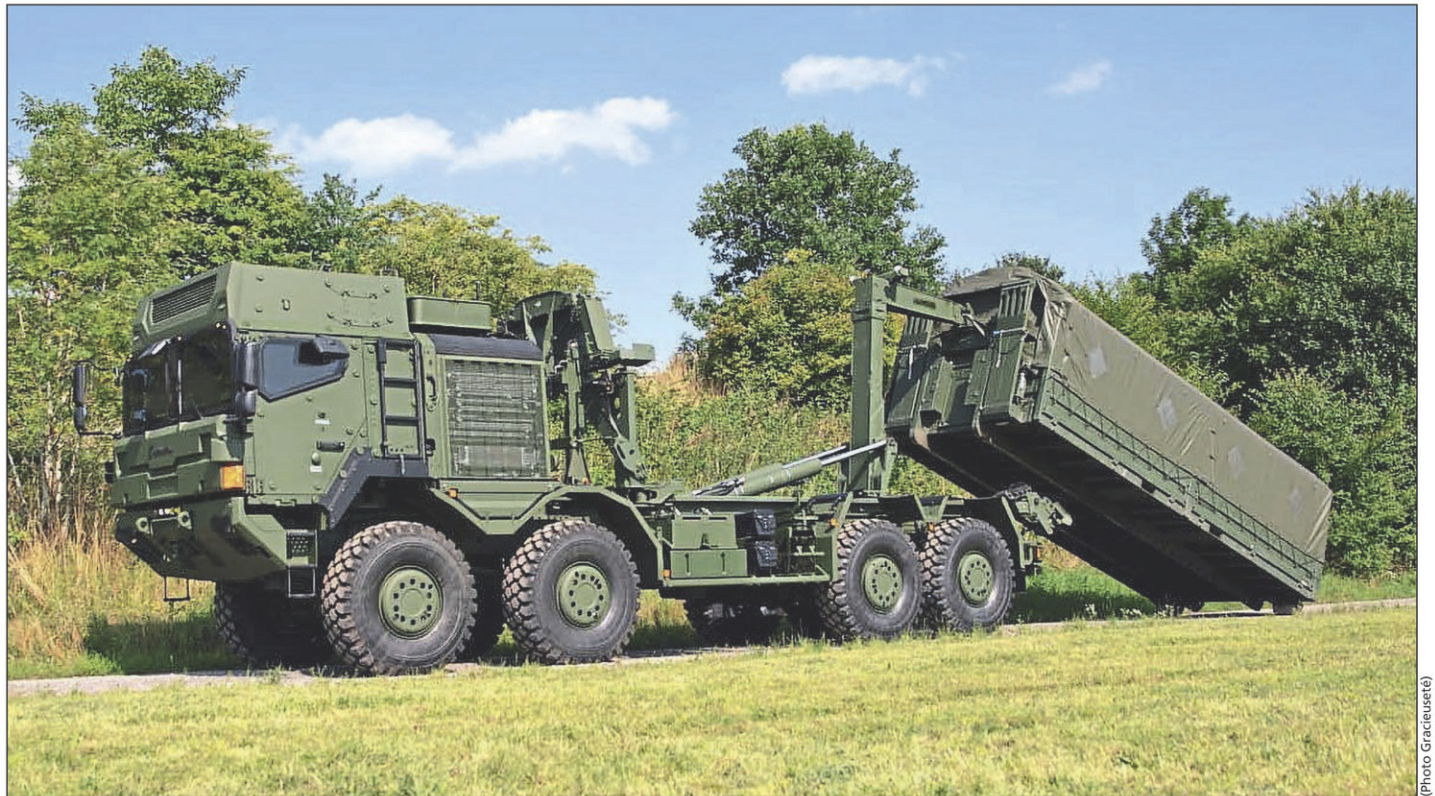
Rheinmetall MAN Military Véhicules, un partenaire de Rheinmetall dans le cadre de ce projet, produit ce type de véhicules militaires.

Dans le cadre de ce contrat, Rheinmetall a uni ses forces avec sa compagnie soeur Rheinmetall MAN Military Vehicles (RMMV), basée à Munich en Allemagne, et l'entreprise ontarienne Navistar Defence Canada. Leur équipe, baptisée Équipe 45°N, travaille également avec sept autres