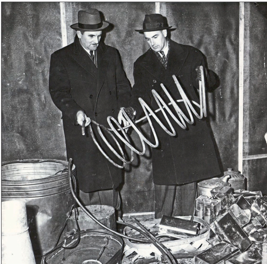
Le terme bootlegger fait référence à quelqu'un qui dissimule une bouteille d'eau de vie dans sa botte ou ses guêtres. Il désigne par extension les contrebandiers d'alcool, durant l'époque prohibitionniste aux États-Unis.