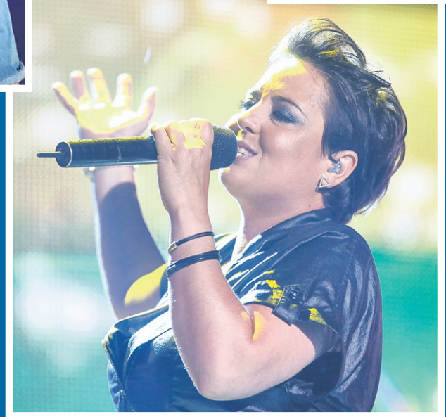
↑ Ariane Moffatt