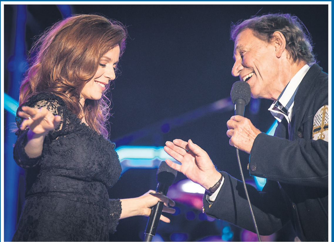
↑ Isabelle Boulay et Jean-Pierre Ferland