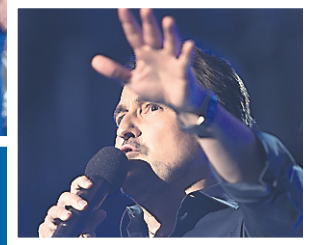
← Guy A. Lepage