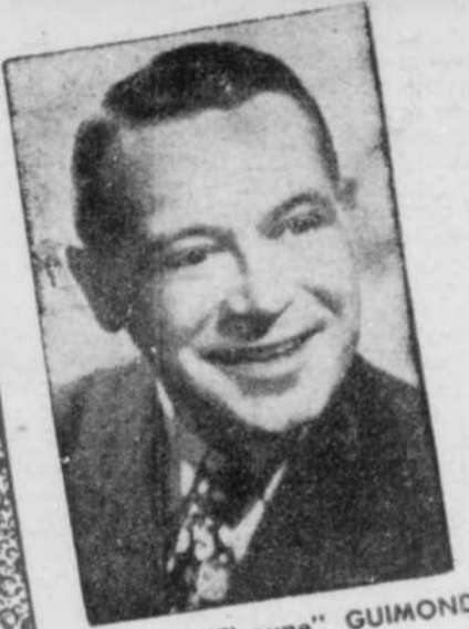
Olivier "Tizoune" GUIMOND