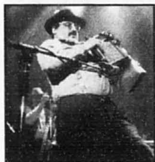
La Bottine Souriante