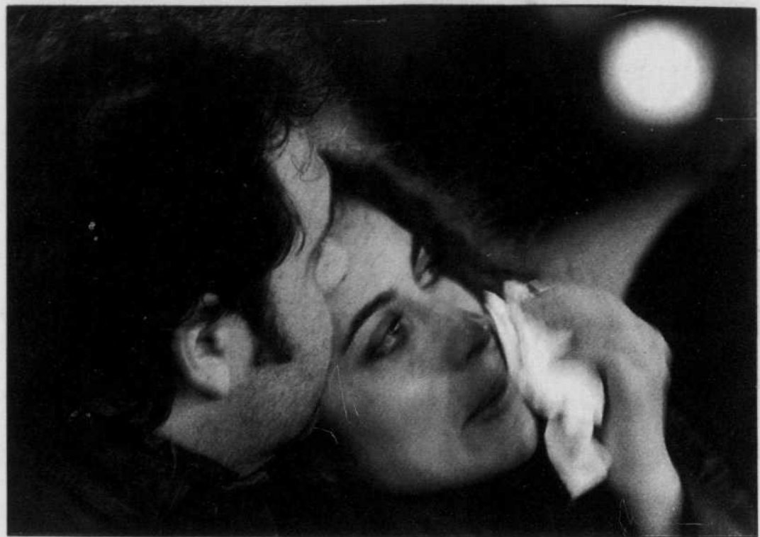
Plus de 70 000 personnes ont prié pour le pape Jean-Paul II la nuit dernière, place Saint-Pierre.