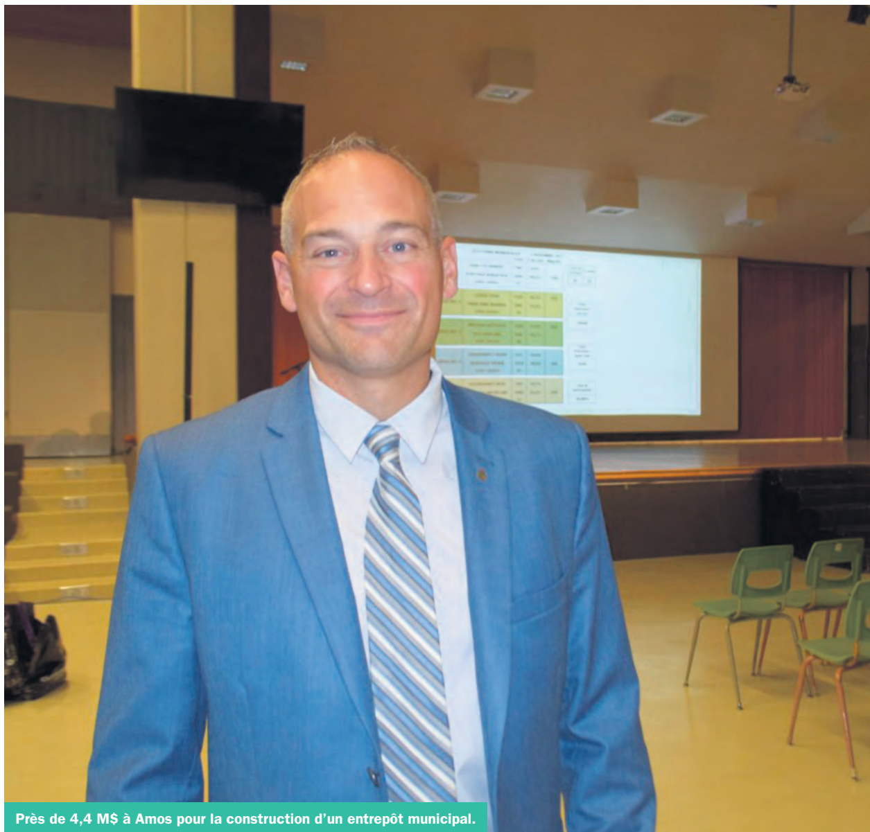
Près de 4,4 M$ à Amos pour la construction d'un entrepôt municipal.

Cette mesure découle de la Politique d'intégration du bois en construction, qui valorise l'utilisation de ce matériau pour ses retombées économiques, sociales et environnementales.