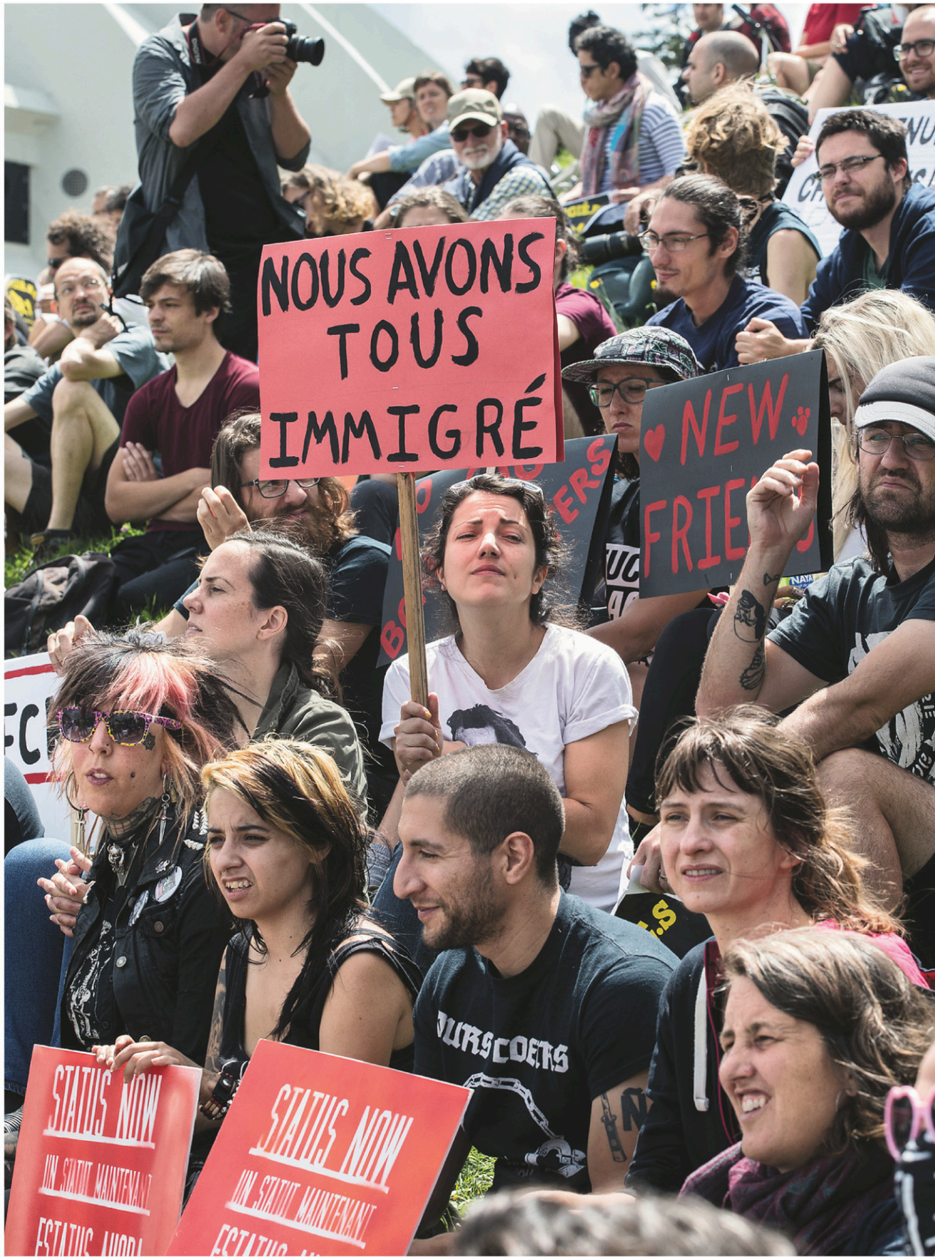
Des centaines de personnes se sont réunies dimanche devant le Stade olympique pour témoigner leur appui aux demandeurs d'asile qui y sont accueillis.