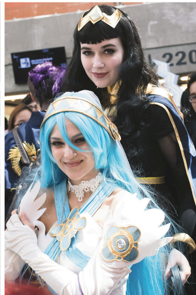
ANNIK MH DE CARUFEL LE DEVOIR

Dans un mélange de culture manga et de musique pop, l'Otakuthon a attiré les amateurs passionnés de danse et de cosplay en fin de semaine au Palais des congrès de Montréal.