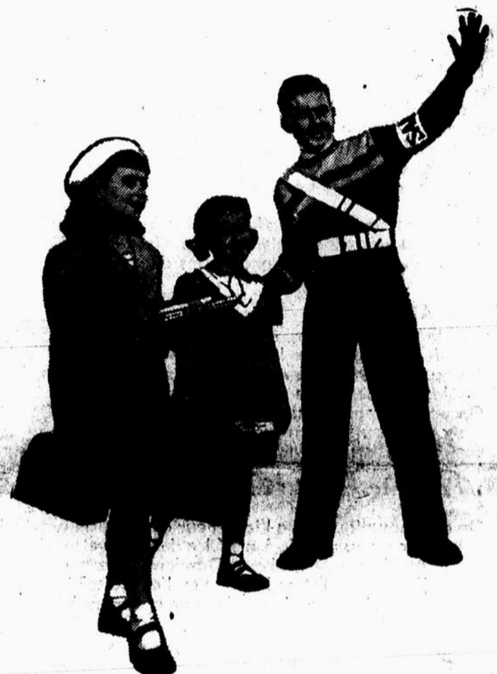
Officier de la ligue de Sécurité Junior tel que nous en verrons à Berthier bientôt, si le projet conjoint du Directeur de l'école et de la Chambre de Commerce est réalisé. Comme on le sait, il s'agit de protéger la vie de nos écoliers en traversant la rue.