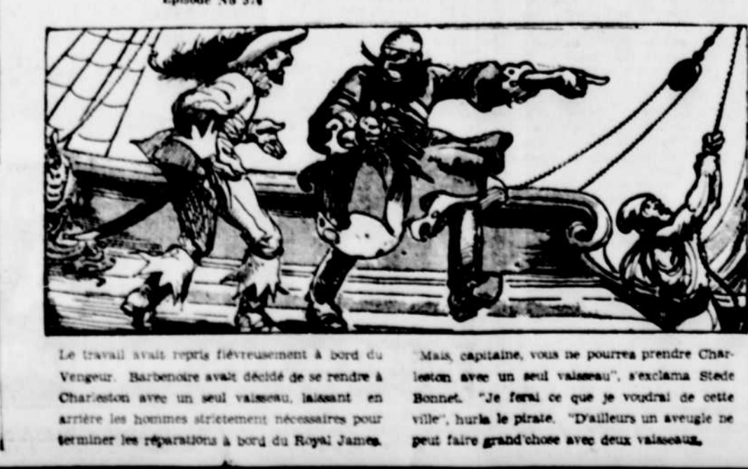
Le travail avait repris fiévreusement à bord du Vengeur. Barbenoire avait décidé de se rendre à Charleston avec un seul vaisseau, s'exclama Stede Bonnet. "Je ferai ce que je voudrai de cette ville", hurla le pirate. "D'ailleurs un aveugle ne peut faire grand-chose avec deux vaisseaux."