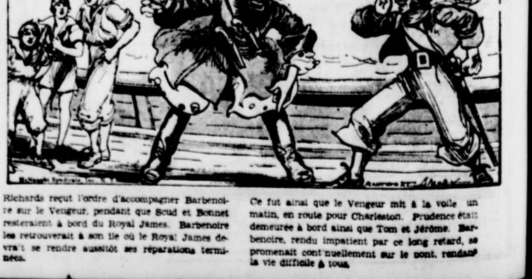
Richard reçut l'ordre d'accompagner Barbenoire sur le Vengeur, pendant que Soud et Bonnet resteraient à bord du Royal James. Barbenoire les retrouverait à son lieu où le Royal James devrait se rendre aussitôt ses réparations terminées.